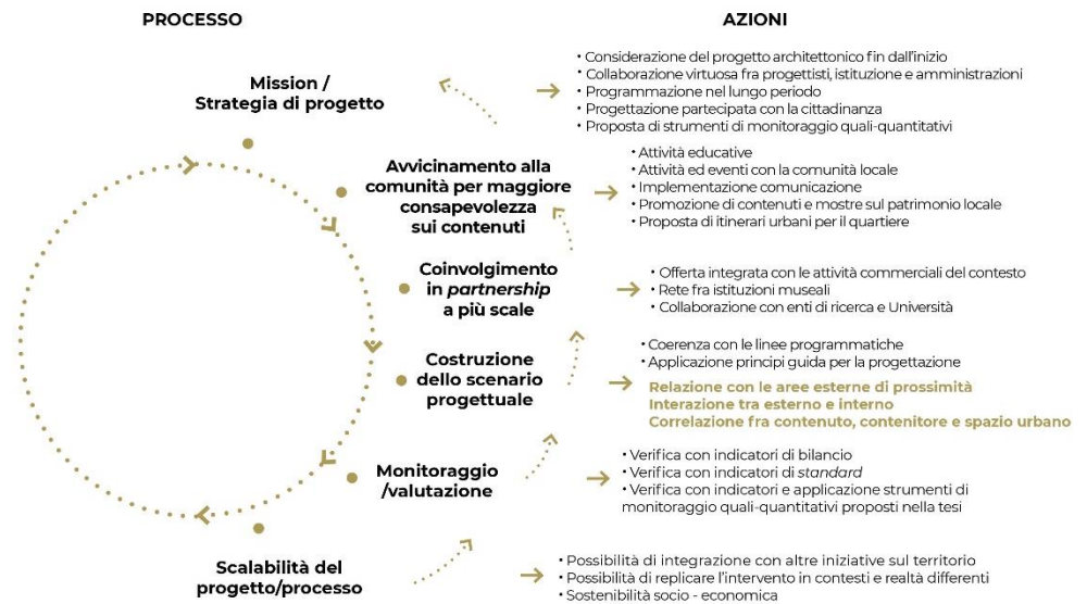
Figura 11. Fasi del progetto partire dalle buone pratiche dei casi studio