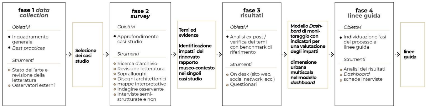
Figura 1. Design di ricerca