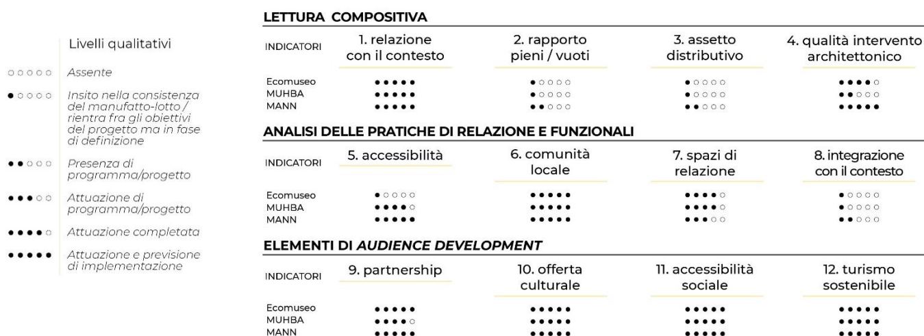
Figura 9. La dashboard cross-analysis: indicatori e rating scale