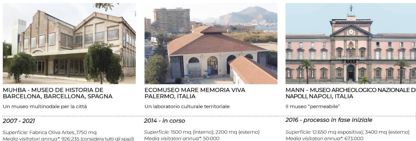
Figura 4. I tre casi studio selezionati e le fasi del processo di trasformazione

attuali competenze progettuali ai nuovi bisogni e al nuovo ruolo dell'istituzione museale nei processi di trasformazione urbana.