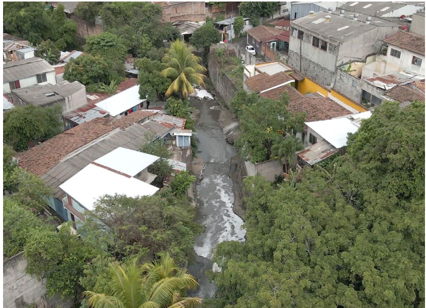
Figura 2. Vista aérea de Quebrada La Mascota y de las viviendas colindantes.

de la comunidad, materializando tanto sus miedos como sus esperanzas, y la realización de un corto audiovisual.