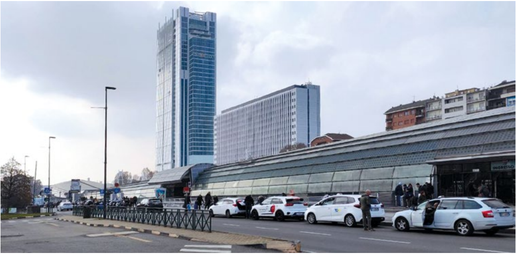
3: Il grattacielo Intesa Sanpaolo e la stazione Porta Susa.

e del Servizio Ferroviario Metropolitano; questo anche per superare i rischi di congestione e iper-polarizzazione rispetto a un sistema ferroviario storicamente radiocentrico dell'area metropolitana torinese.