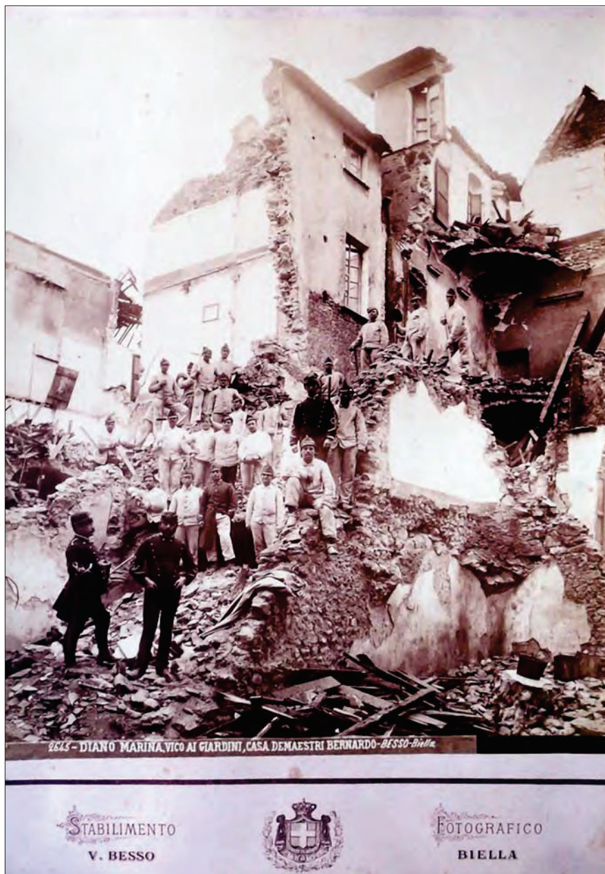
Fig. 1 – Diano Marina, Vico ai Giardini, Casa Demaestri-Bernardo