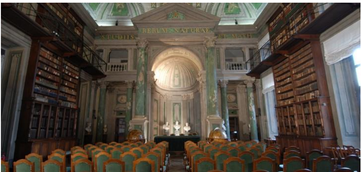
Fig. 2 – La grande Sala dei Mappamondi dell'Accademia delle Scienze di Torino

La Macchina Analitica prevedeva a questo scopo un tamburo, su cui attraverso una serie di tacche e opportuni manovellismi, venivano codificate appunto le operazioni di base più frequenti.