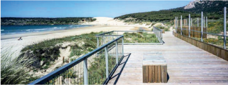
Figura 1 Nuove percorrenze: una passerella lungo la Duna de Bolonia. Fotografia di Jesús Granada, reperibile nel documento relativo al progetto per l'Ensenada de Bolonia, p. 14

inferiori (la Sierra de la Higuera) che generano dei bacini chiusi intorno all'Ensenada, e del mare. Nonostante si tratti di un'area ancora scarsamente interessata da insediamenti e influssi turistici, l'Ensenada non rappresenta un'entità territoriale isolata, poiché condivide e coniuga molte caratteristiche di uno spazio relativamente più ampio, influenzando anche l'area della costa di Cadice. L'ascendente sulla costa gaditana avviene da millenni: infatti il territorio dipendeva già dall'antica città punica e successivamente dalla città romana nota come Baelo Claudia , dichiarata 'monumento storico nazionale' che, insieme al sito archeologico e all'annesso museo, rappresenta uno dei migliori esempi di urbanistica romana più noti nella provincia gaditana, situata nel cuore della baia. Inclusi in questo patrimonio si ricordano, inoltre, altri elementi caratterizzanti e di particolare rilievo, quali il Faro di Camarinal, eretto nel sedicesimo secolo come torre di guardia costiera, le tombe antropomorfe di Betis e la necropoli dell'Algarve, e ancora la Cueva del Moro, noto santuario di età paleolitica. Tra le ricchezze ambientali ritroviamo la bellissima playa de Bolonia, un microsistema naturalistico, la duna de Bolonia, che assume un aspetto sempre differente a seconda del vento, e la playa del Canuelo.