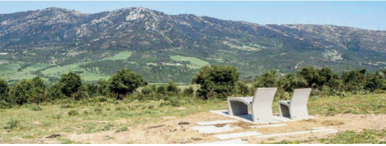
Figura 2 Una vista suggestiva: per enfatizzare la vista sulla necropoli antropomorfa, le cui sepolture sono scavate nella roccia della montagna antistante, vengono collocate delle sedute orientate e integrate al contesto naturale. Fotografia di Jesús Granada, reperibile nel documento relativo al progetto per l'Ensenada de Bolonia, p. 29

inteso come barriera fisica e visiva, ma come elemento che accresce il valore delle rovine romane e parallelamente si elabora una nuova immagine correlata del museo archeologico, inserendo pannelli informativi e arredi urbani uniformati e più efficaci nella divulgazione di contenuti per i visitatori [figg. 4-5].