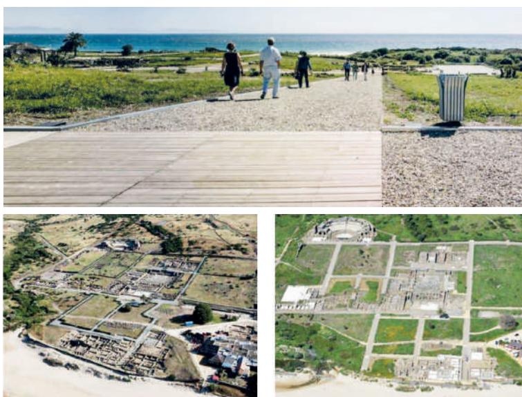
Figura 3 Nuove percorrenze: nel sito archeologico di Baelo Claudia vengono recuperati gli antichi tracciati della città romana, valorizzando la vista sul paesaggio.