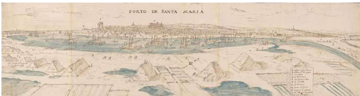
4. Veduta del sistema produttivo delle saline di El Puerto de Santa Maria. Sullo sfondo la città di Cadice. Disegno di Anton van den Wyngaerde del 1567. (Immagine reperibile sul sito: http://www2.ual.es/ideimand/portfolio-items/dibujo-de-el-puerto-de-santa-maria-anton-van-der-wyngaerde-h-1560/ ).