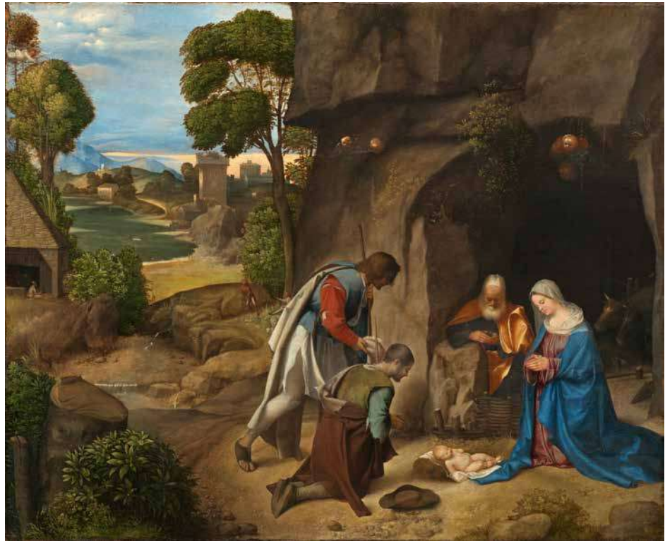
Giorgione, L'adorazione dei pastori , 1503 c., Samuel H. Kress Collection, Courtesy National Gallery of Art, Washington, cfr. Enrico GUIDONI, Giorgione. Opere e significati , Editalia, Roma 1999, pp. 128-135.