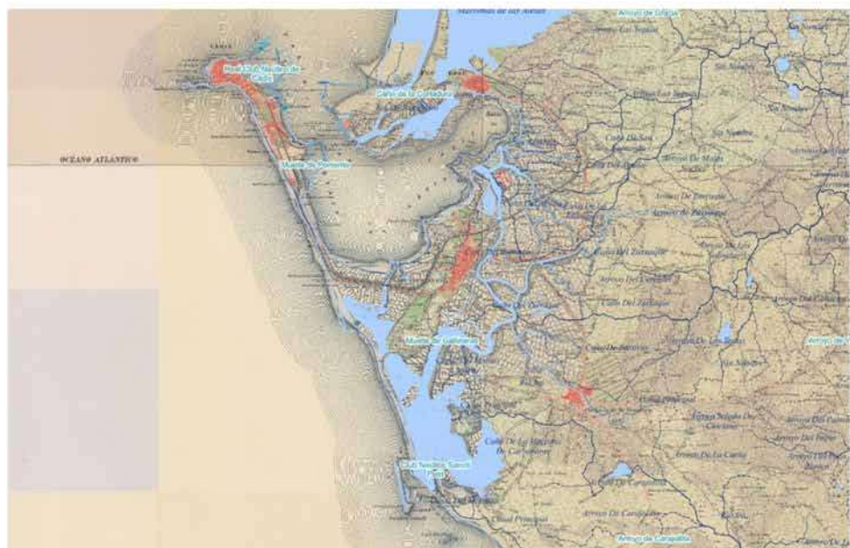
1. Immagini dell'area della baia di Cadice a confronto, con in evidenza il sistema idrografico territoriale (rielaborazione dell'autrice a partire dalle Carte Topografiche Nazionali 1:50.000 – MNT50, reperibili dal sito dell'Istituto Geografico Nazionale di Spagna al sito: https://www.ign.es/web/cbg-area-cartografia ).