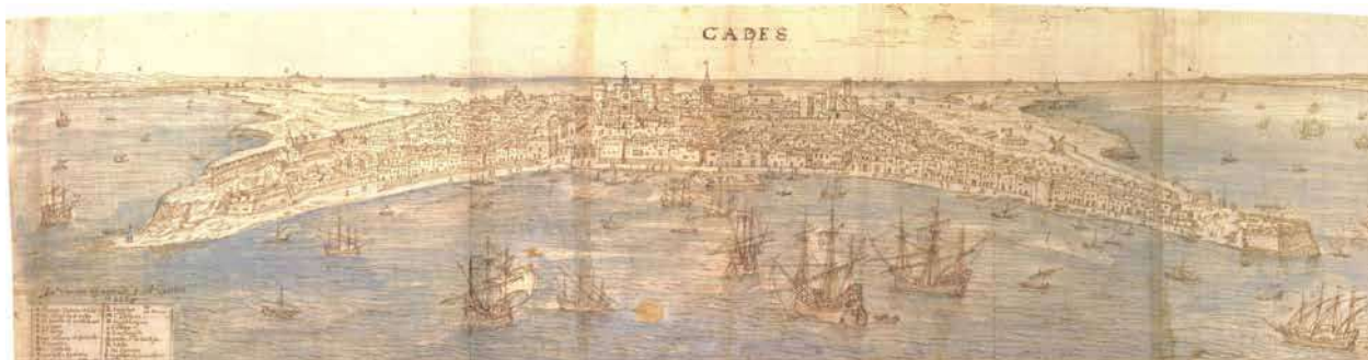
3. Veduta della propaggine estrema della penisola di Cadice ad opera di Anton van den Wyngaerde del 1567.