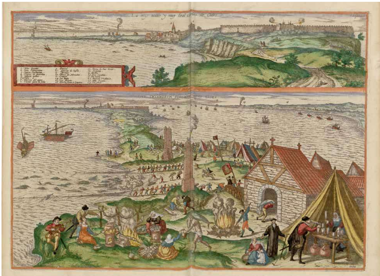
2. Due vedute di Cadice del 1598 contenute nel Civitates Orbis Terrarum ad opera di Georg Hoefnagel. In alto una veduta dalla punta di San Sebastiano; in basso l'illustrazione dell'attività ittica e relativo processo di lavorazione del pesce (Immagine reperibile sul sito: https://digi.ub.uni-heidelberg.de/diglit/braun1599bd5/0041 ).