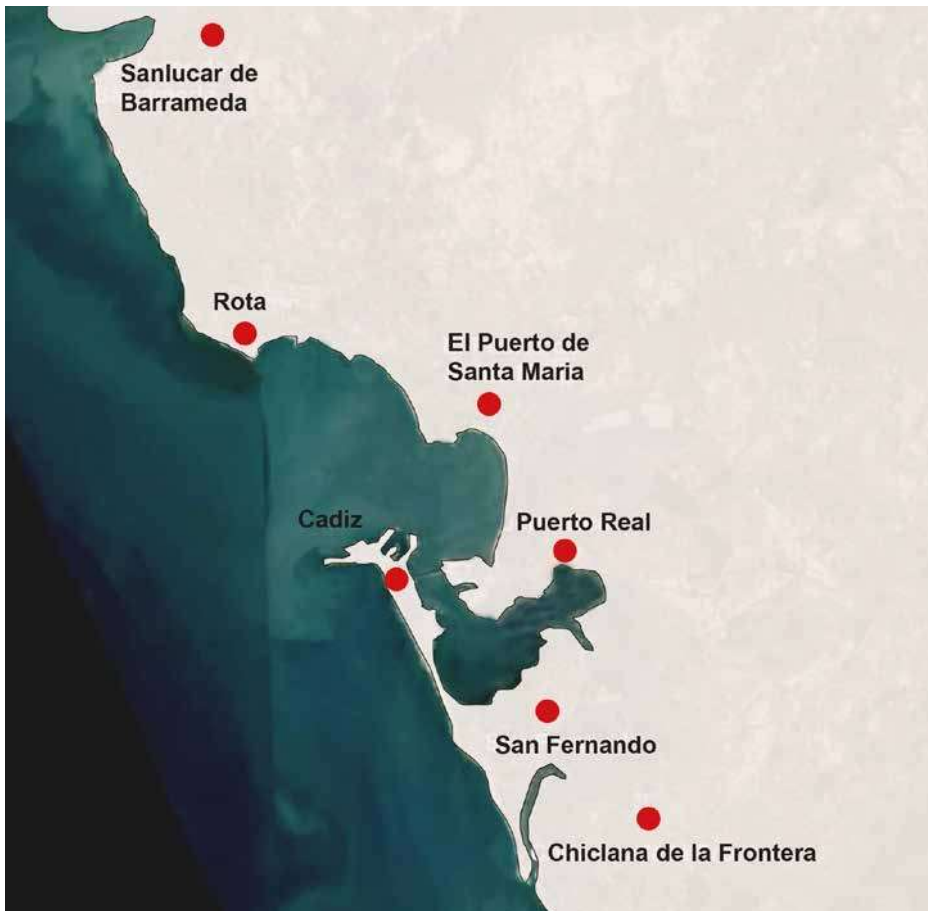
5. Mappa con i principali poli di produzione e lavorazione del sale nella baia di Cadice (Rielaborazione dell'autrice).