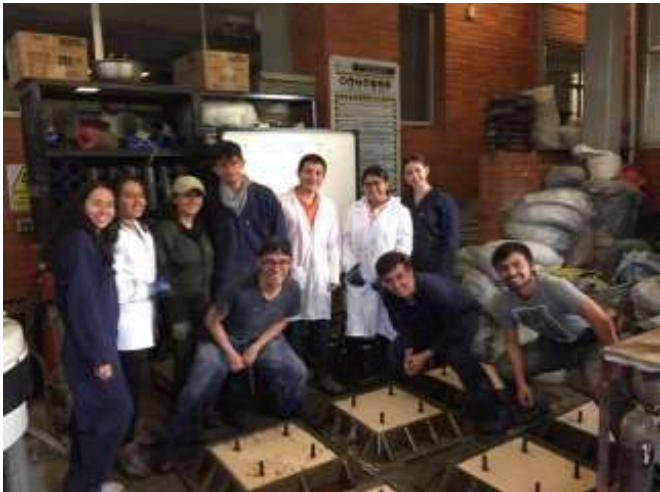
Fig. 4 Construcción de cimientos. Laboratorio PUJ.

En la fase de construcción surgió el papel fundamental de la “sala de control” del grupo de docentes, quienes coordinaron todas las etapas, poniendo de manifiesto un hecho a menudo subestimado por los estudiantes de arquitectura y un poco descuidado en los cursos académicos: además de un buen proyecto, el éxito de una obra radica en la logística, la organización y la eficacia de la coordinación. En la construcción del prototipo participaron los estudiantes de Nuevos Territorios y el cuerpo docente del curso, un grupo de otros estudiantes más maduros que habían participado en otras fases anteriores del proyecto, estudiantes y profesores del Politecnico di Torino que habían colaborado desde Italia en las evaluaciones de sostenibilidad del proyecto, y expertos técnicos de algunas de las empresas que apoyaron el proyecto. La obra duró aproximadamente un mes con turnos de trabajo diurnos y nocturnos -siempre siguiendo las normas de seguridad del concurso- y vio el compromiso constante de todo el equipo. La obra fue una experiencia compleja de la cual se pueden hacer muchas consideraciones desde el punto de vista de la capacitación de los participantes. Algunas de estas observaciones se presentan a continuación: