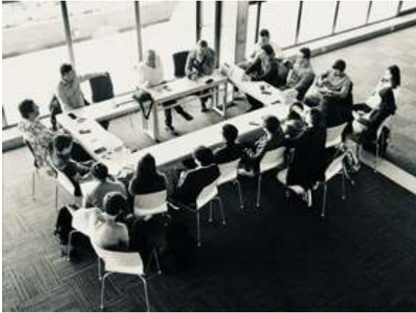
Fig. 1 Clase como estudio de arquitectura.

Con esta organización general, los momentos de formación siempre tuvieron lugar de una manera colegiada, comentando los progresos de cada grupo en un debate abierto y a través de seminarios temáticos. Se invitó a expertos técnicos del sector de la construcción, que fueron consultados por la clase, para explicar las tecnologías y alternativas del mercado y seleccionar las mejores soluciones, por ejemplo, para las ventanas y puertas, el tratamiento de los componentes de madera, la forma de instalar las placas de cubierta corrugada y otros temas específicos. Además de las sesiones de formación colegial, los profesores siempre estuvieron disponibles a solucionar las dudas de los grupos sobre temas puntuales del diseño del proyecto como la verificación del control y protección solar de las ventanas, la conexión de los marcos de las ventanas a la estructura, la apertura del brise-soleil, el sistema de levantamiento de las cubiertas laterales para el uso de los espacios del ático para mantener la posibilidad de recoger el agua de lluvia, etc(Figura 2).