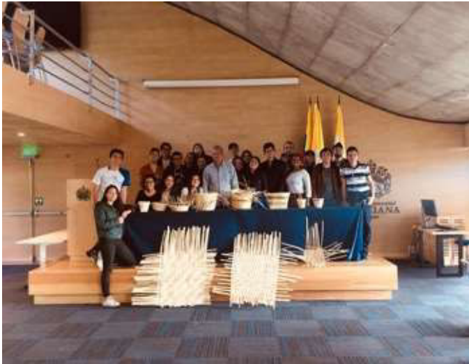
Fig. 3 Talleres de tejidos con fibras naturales junto a expertos artesanos.

gracias al estímulo de tener los materiales en sus manos, los estudiantes exploraron numerosas posibles aplicaciones del tejido: para cielorrasos, la creación de muebles, reflectores para lámparas, entre otros. Si bien algunas de estas hipótesis no fueron incluidas en el diseño final de casa, han sido parte del proceso creativo y por lo tanto formativo.