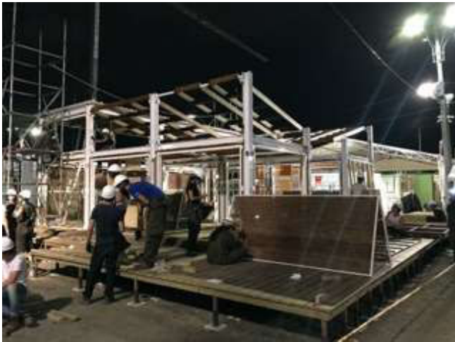
Fig. 5 Construcción en equipo.

Después de la construcción del prototipo, la apertura de la Villa Solar al público, la presentación de la obra al jurado del concurso, el monitoreo del funcionamiento de la vivienda, la visita a las otras casas y los momentos de compartir con otros equipos internacionales completaron la gran experiencia de aprendizaje. Los resultados obtenidos en el SDLA&C2019 fueron una gran recompensa por el gran compromiso del equipo. PEI Máquina Verde - El Arca obtuvo 2 primeros premios en las categorías "Ingeniería y Construcción" y "Diseño Urbano y Asequibilidad", 4 segundos premios en las categorías "Arquitectura", "Innovación", "Eficiencia Energética", "Consumo de Energía" y un tercer premio en la categoría "Comunicación, marketing y conciencia social", para un total de 7 premios en las 10 categorías evaluadas y clasificándose segundo en la competición general (Figura 6).