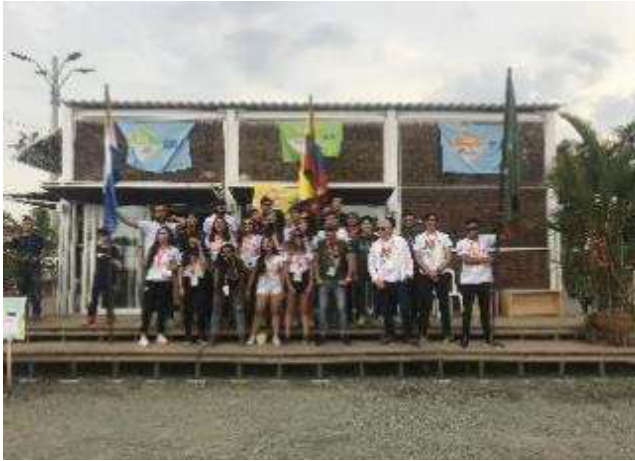
Fig. 6 Construcción en equipo.