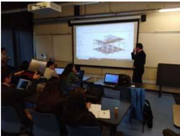
Fig. 2 Sesiones de clase con expertos.

Con esta organización general, los momentos de formación siempre tuvieron lugar de una manera colegiada, comentando los progresos de cada grupo en un debate abierto y a través de seminarios temáticos. Se invitó a expertos técnicos del sector de la construcción, que fueron consultados por la clase, para explicar las tecnologías y alternativas del mercado y seleccionar las mejores soluciones, por ejemplo, para las ventanas y puertas, el tratamiento de los componentes de madera, la forma de instalar las placas de cubierta corrugada y otros temas específicos. Además de las sesiones de formación colegial, los profesores siempre estuvieron disponibles a solucionar las dudas de los grupos sobre temas puntuales del diseño del proyecto como la verificación del control y protección solar de las ventanas, la conexión de los marcos de las ventanas a la estructura, la apertura del brise-soleil, el sistema de levantamiento de las cubiertas laterales para el uso de los espacios del ático para mantener la posibilidad de recoger el agua de lluvia, etc(Figura 2).