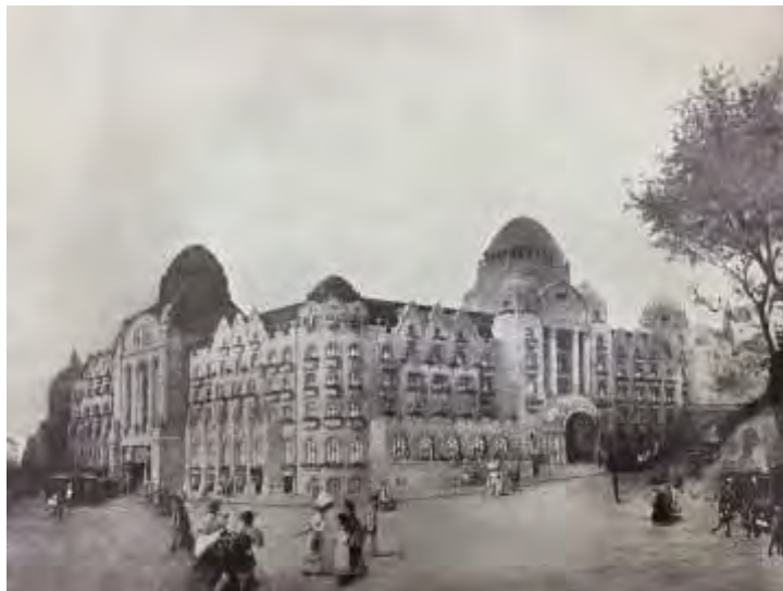
Veduta di progetto dell'Hotel & terme Gellért, in Die Städtischen Thermalbäder von Budapest. Artesisches Bad. Blocksbad. Bruckbad, Dresden 1911, FSZEK

“Attraversando il Ponte Francesco Giuseppe ci troviamo ai piedi del monte Gherardo, dinanzi allo Stabilimento dei Bagni di S. Gherardo), reputato come il più moderno ed il più elegante tra gli stabilimenti del genere della capitale. È un edificio magnifico costruito durante la guerra ed inaugurato alla fine del 1918. L'impianto delle terme presenta ugualmente la più moderna perfezione e soddisfa anche le più difficili pretese. Gli elementi principali della cura medica sono le sorgenti termali della temperatura di 46° Celsio (2.600.000 litri al giorno) ed i fanghi naturali che hanno una potenza curativa straordinaria. [...] Soprattutto in casi di reuma, gotta e artrite l'uso dei bagni reca una guarigione sorprendente, per il qual motivo le sorgenti attirano una quantità considerevole di forestieri fin dal tempo dell'occupazione turca. Per rendere maggiore la comodità dell'uso del bagno il Grand Hotel delle Terme di S. Gherardo si è installato nello stesso edificio dello stabilimento termale. Quest'albergo, pure gestito dal