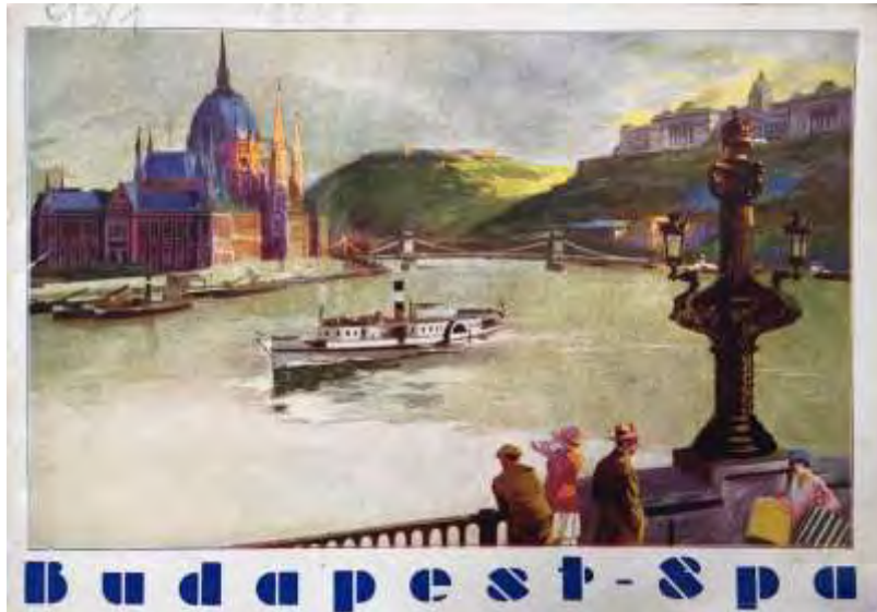
Budapest Spa, Budapest 1928

Le politiche urbane della capitale ungherese, però, avevano individuato con chiarezza il filone termale come uno degli assi portanti dello sviluppo della città, e finalmente, nel 1911 viene dato avvio ai lavori di completa ricostruzione delle terme Sáros. Budapest, le sue terme e le sue politiche in questo ambito sono degnamente rappresentate alla Esposizione igienica del 1911 a Dresda. Nell'opuscolo 16 relativo alla città di Budapest sono presentati i progetti per il nuovo Blocksbad, ovvero le nuove terme Sáros (poi Gellért), con pianta dettagliata in cui si evincono funzioni e piscine, provviste di hotel con acqua termale in camera, e quelli per la