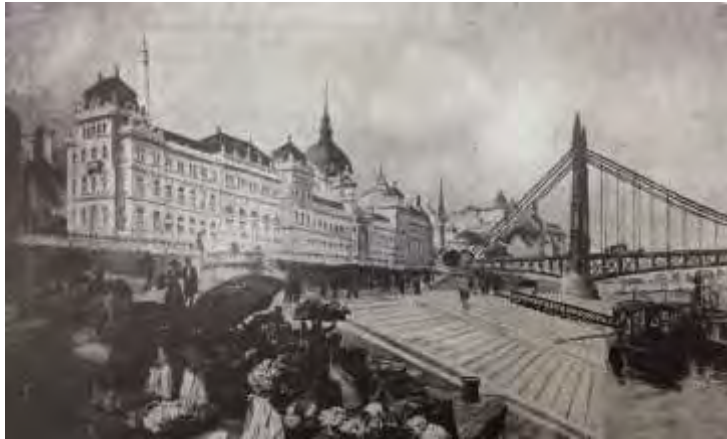
Proposta di ricostruzione delle terme Rudas, non realizzata, in Die Städtischen Thermalbäder von Budapest. Artesisches Bad. Blocksbad. Bruckbad, 1911, FSZEK