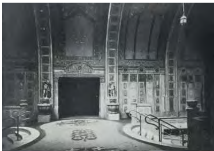
Hotel Gellért, Sala termale femminile, in E. Liber, Budapest-Fürdőváros Kialakulása, Budapest 1936, FSZEK

Negli anni '20 e '30 l'hotel Gellért è palcoscenico della vita mondana budapestina e del jet set internazionale (vi dimorano la regina d'Olanda, re e granduchi d'Europa, sindaci, maraggià...) ma anche di numerosi eventi legati a manifestazioni congressuali, rientrando pienamente in quella intelligente politica municipale e nazionale che promuoveva l'intreccio di turismo termale e convegnistico. Nelle sue sale sono allestiti banchetti per la Camera degli avvocati