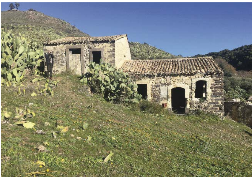
Figg 7 e 8 Alcuni edifici del borgo dove risulta evidente lo stato di degrado e di totale abbandono.