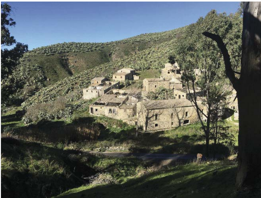
Fig. 2 Il piccolo borgo della conceria incastonato tra le colline, come si presenta oggi.

Tutto attorno, verde. Colline, per la maggior parte punteggiate da fichidindia, caratterizzano la vallata sottostante. Su una di queste, quasi nascosto alla vista, sorge un piccolo borgo industriale dove, fino ai primi anni del '900, veniva praticata la concia delle pelli, antica attività artigianale vanto della città, da sempre chiamato "a cunziria ", che nel dialetto siciliano significa "la conceria".