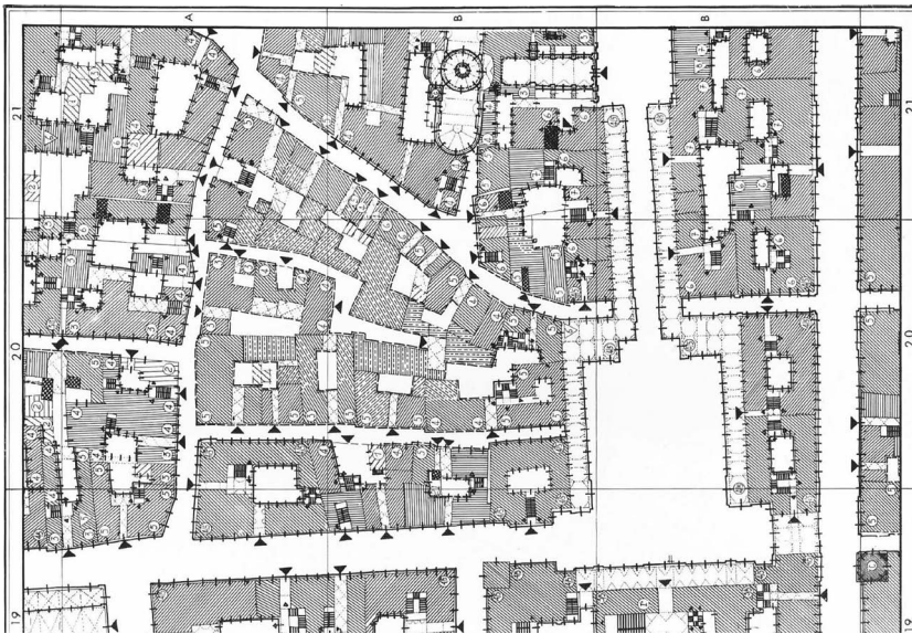
Fig. 1 - Tessuti urbani entro le mura di Torino nell'ultimo quarto del Settecento (Scala 1:1000). Rilievo congetturale dell'Istituto di Architettura Tecnica del Politecnico di Torino. Rielaborazione grafica delle annotazioni collegiali a cura di S. Coppo e P. Scarzella, striscia 3, vo. II, A, mappa 2, da: Istituto di Architettura Tecnica del Politecnico di Torino (1968) Forma urbana ed architettura nella Torino barocca (dalle premesse classiche alle conclusioni neoclassiche), UTET, Torino. Il dettaglio della mappa fornisce un campione della lettura diagrammatica della città operata da A. Cavallari Murat, attraverso il ricorso a simboli grafici e convenzioni originali che consentono di leggere la mappa tipologica come congettura, fornendo, in sequenza con le altre mappe tipologico-congetturale della stessa area, una lettura diacronica delle dinamiche transizionali di metamorfosi urbana in atto nell'intervallo di tempo considerato.

Urban fabrics within the walls' precinct of Torino in the last quarter of the eighteenth century (Scale 1: 1000). Conjectural survey of Istituto di Architettura Tecnica del Politecnico di Torino. Graphic re-working of the collegial annotations by S. Coppo and P. Scarzella, strip 3, vo. II, A, map 2, from: Istituto di Architettura Tecnica del Politecnico di Torino (1968) Forma urbana ed architettura nella Torino barocca (dalle premesse classiche alle conclusioni neoclassiche), UTET, Torino. The detail of the map provides a sample of the diagrammatic reading of the city made by A. Cavallari Murat, through the use of graphic symbols and original conventions that make possible reading the typological map as a conjecture, providing, in sequence with the other typological-conjectural maps of the same area, a diachronic reading of transitional dynamics of urban metamorphosis in progress in the considered time.