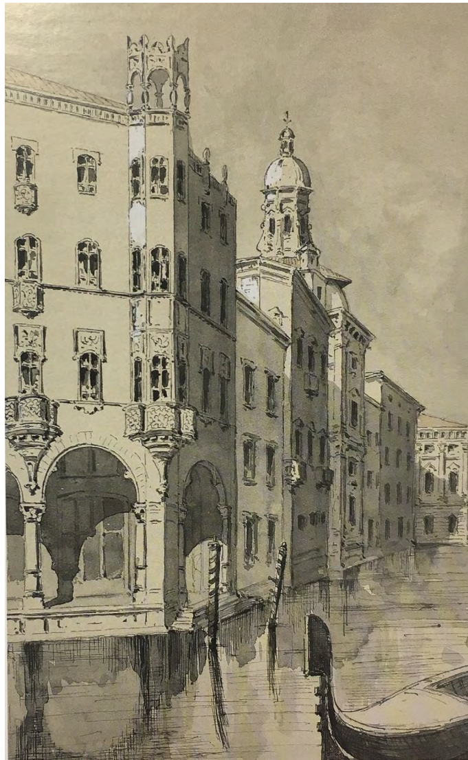
Figura 7: Carlo Ceppi, Dibujo en acuarela de Casa Bellia ambientada en Venecia, finales del siglo XIX

diferentes elementos compositivos, el porche, una estructura que distingue el escenario urbano de Turín, asume un papel fundamental estableciendo una continuidad de camino entre dos puntos cruciales de la ciudad: las estaciones de Porta Nuova y de Porta Susa. 33 Entre los diferentes porches turineses, los de casa Bellia gozan de una estructura portante de hormigón armado con el sistema Hennebique que permite aumentar la luz de los locales en la planta baja y, por lo tanto, del área acristalada de las tiendas. 34