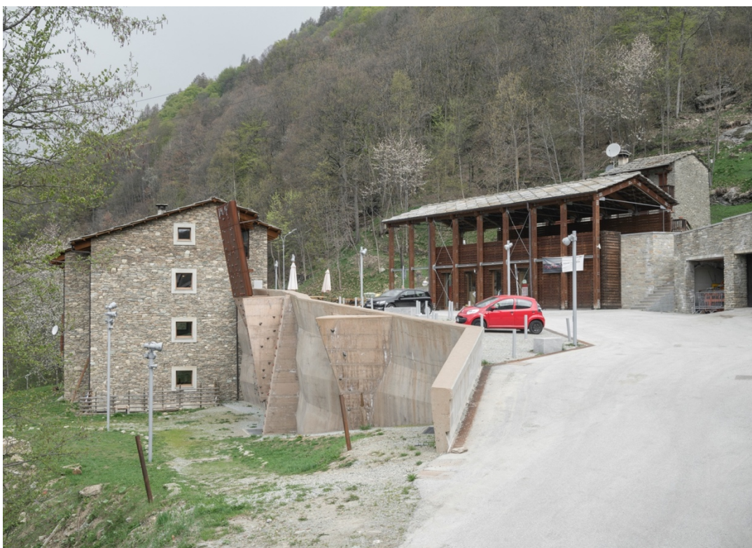
(Fig. 8) Porto Ousitano , la sistemazione dell'area di ingresso alla Borgata La villo a Ostana. In primo piano il muro di arrampicata sportiva e, sullo sfondo, la tettoia pubblica con l'info-point e il nuovo spazio pubblico (M. Crotti, A. De Rossi, M-P. Forsans, L. Dutto, S. Beccio – 2011/13) e il rifugio "la Galaberna".

Il rilancio dell'architettura, e con essa dei valori del paesaggio locale, è stato avviato negli anni '80 dall'architetto locale Renato Maurino ed è proseguito, negli ultimi due decenni, con i progetti e le attività di accompagnamento all'amministrazione da un insieme di docenti del Politecnico di Torino – coordinati in varie occasioni da Massimo Crotti e Antonio De Rossi – e di alcuni professionisti – tra i quali ricorrono i nomi degli architetti Marie-Pierre Forsans e Luisella Dutto – che hanno messo a punto un numero articolato di interventi 4 fondati sui principi del riuso adattivo del costruito in abbandono e sulla reinterpretazione e innovazione dei caratteri della tradizione architettonica alpina. (fig. 8)