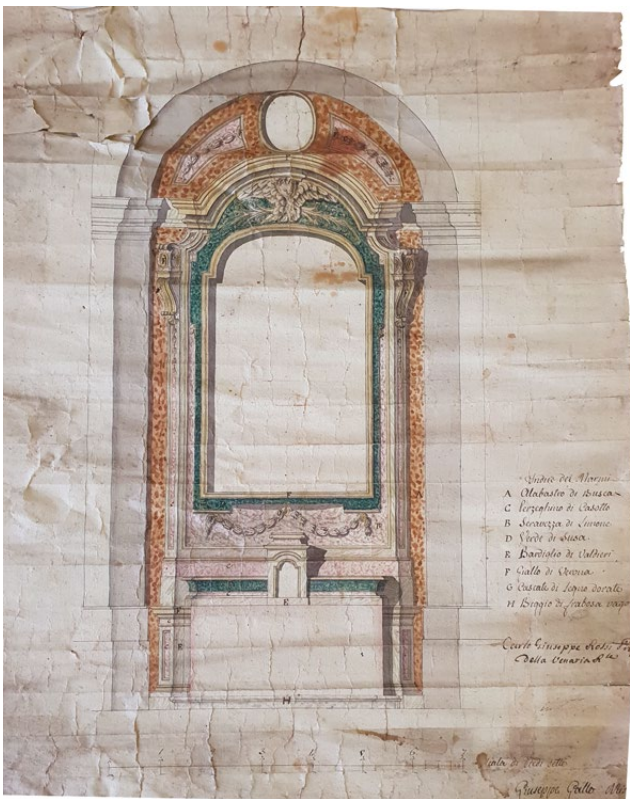
fig. 4 – GIUSEPPE GALLO, Altare della Concezione, 22 aprile 1790 (ASP Venaria, Fondo parrocchiale della Natività di Maria Vergine di Venaria Reale, Beneficio, Tipi e disegni, fasc. 460).