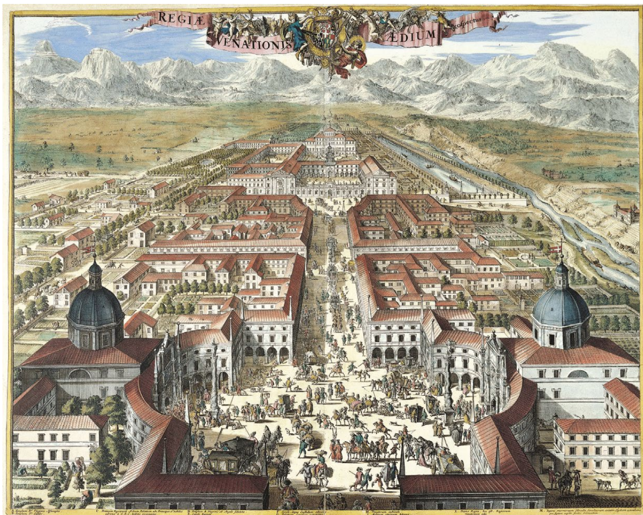
fig. 1 – GIOVANNI TOMMASO BORGONIO, Regiae Venationis Aedium Prospectus , [1670], in Theatrum Statuum Regiae Celsitudinis Sabaudiae Ducis, Pedemontii Principis, Cypris Regis , Apud Haeredes Ioannis Blaeud, Amstelodami, 1682, I.37.

Emerge pure la relazione specifica dedicata alla stessa Venaria che ricorda le due progettate chiese in piazza dell'Annunziata.