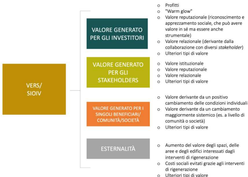
Fig. 2 - Le componenti del SIOIV-Social Impact-Oriented Initiatives Value.

Per le iniziative orientate all'impatto sociale nei processi di rigenerazione urbana e periurbana si potrebbe proporre invece il concetto di Valore Economico di Responsabilità Sociale (VERS) o Social Impact-Oriented Initiatives Value (SIOIV), che reinterpreta e integra il VET con ulteriori dimensioni e componenti di valore (vedi Fig. 2).