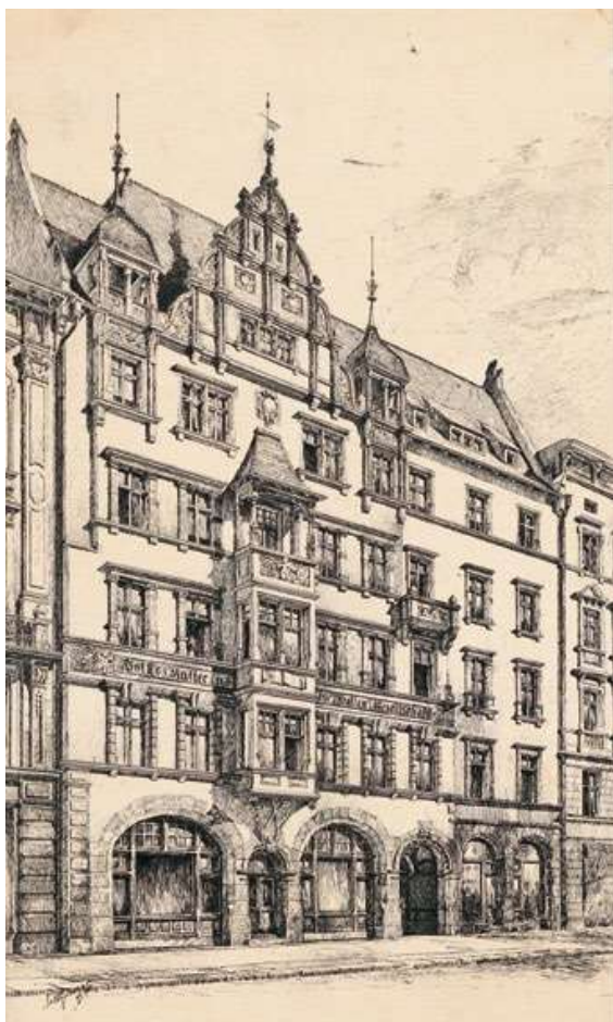
2: Alfred Messel, Gesellenheim della Volks-Kaffee und Speisehallen-Gesellschaft, Chausseestraße 98a Berlino 1891 [Architekturmuseum Technische Universität Berlin].