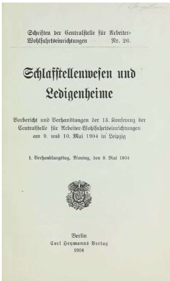
1: Frontespizio del volume relativo alla XIII Conferenza del Centralstelle für Arbeiter- Wohlfahrtseinrichtungen di Lipsia del 1904.

Nel 1910 a Berlino si contavano 66.300 uomini e 22.200 donne in stanze in subaffitto [ZBV 1919]. La progettazione dei complessi per lavoratori celibi in Germania, pur seguendo a grandi linee modelli sorti decenni prima in Inghilterra, a causa del maggiore radicamento del sistema industriale e della necessità di trovare risposte a tali esigenze, differiva fundamentalmente per l'impostazione: «in molteplici Ledigenheim tedeschi si segue il principio della camera individuale – in contrasto con il sistema, abituale in Inghilterra, delle cabine o cuccette» [Eberstadt 1920, 556].