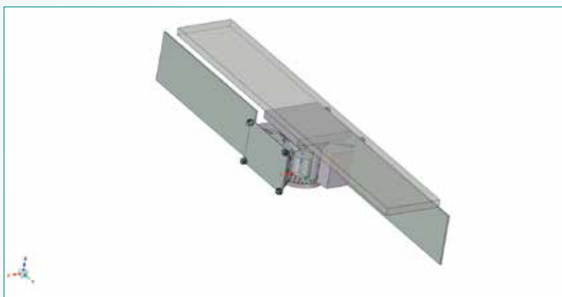
Fig. 1 - CAD model preliminare.

Rilevante valore aggiunto del SAR è quello di acquisire immagini in tutte le condizioni atmosferiche per aiutare la prevenzione e l'analisi dei disastri dovuti a cause naturali o cause antropiche e per tutti i precursori dei fenomeni di disastri ambientali. In questo scenario NOCTUA, un progetto portato avanti da una partnership con capofila D-Orbit e finanziato dalla Regione Lombardia, offre molteplici opportunità e prevede di installare il satellite SAR su una piattaforma per mini/microsatelliti, avendo come obiettivo principale quello di abilitare un servizio all'avanguardia di osservazione della Terra per il monitoraggio di infrastrutture.