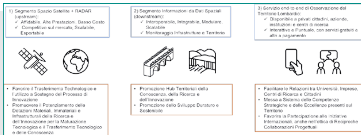
Fig. 3 - Obiettivi di progetto (blu) Vs Obiettivi strategici (rosso).

Ciò permetterà di superare quelle difficoltà tipiche dal complesso processo di accesso, acquisizione ed elaborazione dei dati SAR grezzi, emerse anche nel contesto del programma europeo Copernicus dove la difficoltà appunto nell'accesso/acquisizione del dato, unito alla frammentazione del mercato, alla difficoltà nel collegare e far incontrare in modo efficiente domanda e offerta di prodotti e servizi offerti (Andrea Taramelli, De Bernardinis, and Castellani 2020), risultano essere alcuni dei principali problemi del programma, limitando il vero sviluppo dell'enorme mercato downstream ad esso collegato.