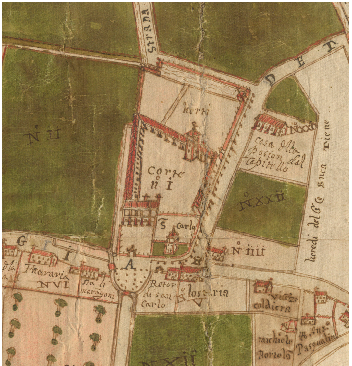
2 Dettaglio centrale della mappa in cui sono evidenziati tutti gli elementi architettonici del complesso di Villa Valmarana; si noti la posizione dell'Oratorio di San Carlo rispetto alla casa padronale e agli annessi rustici della villa, con affaccio sulla strada pubblica e recinzione, nel rispetto delle norme sinodali. BBVI, mappa XVII b. 3, 1639.

caratteristiche per la loro condizione di architetture private, nel senso della proprietà, e allo stesso tempo pubbliche, nel senso della destinazione di culto. La ricerca condotta sugli oratori di villa nella campagna vicentina tra diciassettesimo e diciottesimo secolo 4 ha dimostrato quanto sostenuto dalla letteratura giuridica: 5 al fine di ottenere la licenza a erigere un oratorio, il committente doveva solamente dichiarare una discreta lontananza dalla chiesa parrocchiale, motivazione considerata più che lecita da parte della curia vescovile, pur di tutelare l'adempimento del precetto festivo per il contado. 6 Il diffondersi di questa prassi tra i committenti, ossia quella di