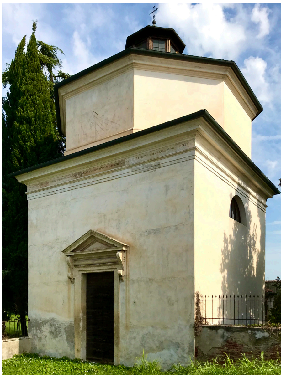
3 Lisiera (Vicenza), Oratorio San Carlo di Villa Valmarana, prospetto principale sulla strada.