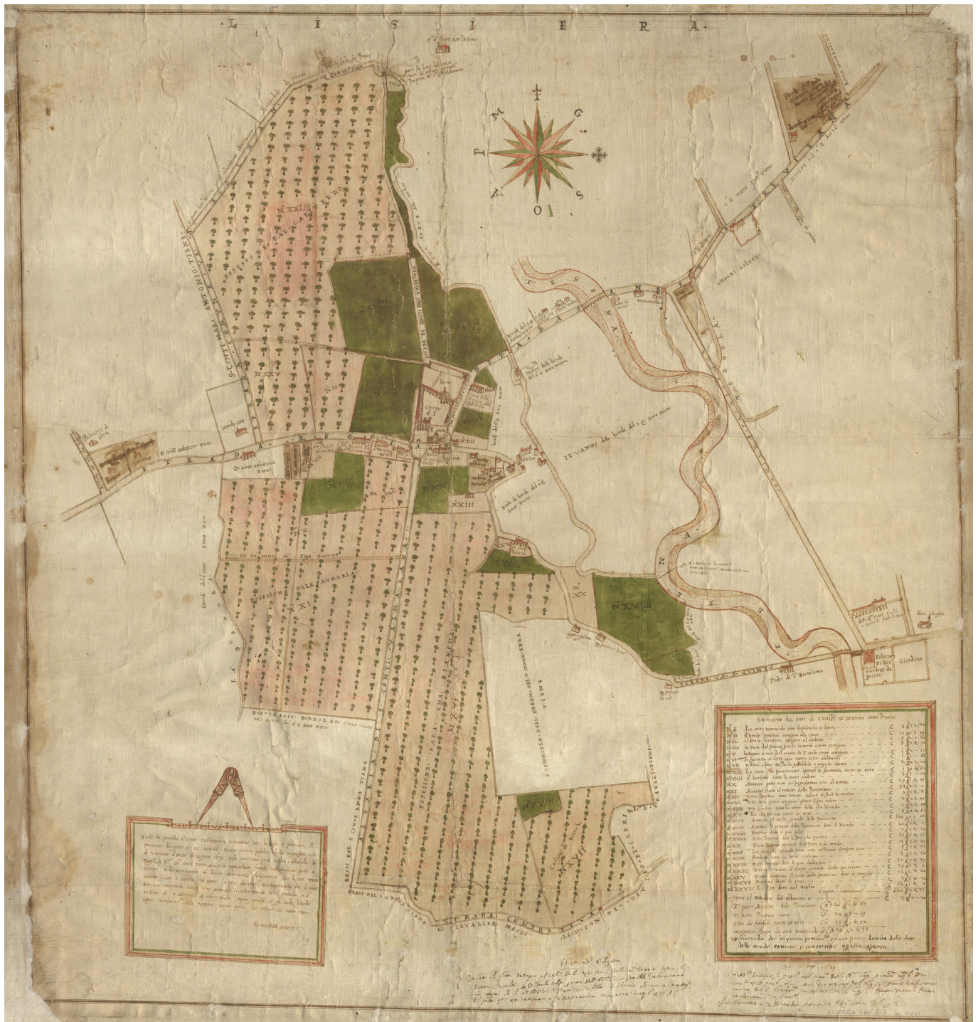
1 Possedimenti fondiari dei conti Valmarana in Lisiera (Vicenza). BBV, mappa XVII b. 3, 1639.

l'istituto dell'oratorio. 2 Le disposizioni tridentine deliberarono che il diritto di celebrare messa in uno spazio privato potesse essere concesso solo attraverso l'indulto, competenza riservata esclusivamente alla Santa Sede, riconoscendo, di contro, un'identità giuridica all'oratorio pubblico. Il decreto costituisce la premessa su cui il diritto canonico ha successivamente circoscritto la fattispecie dell'oratorio pubblico, definendone le caratteristiche tali per cui è possibile riconoscerlo in maniera univoca rispetto a qualsiasi altro edificio sacro. 3