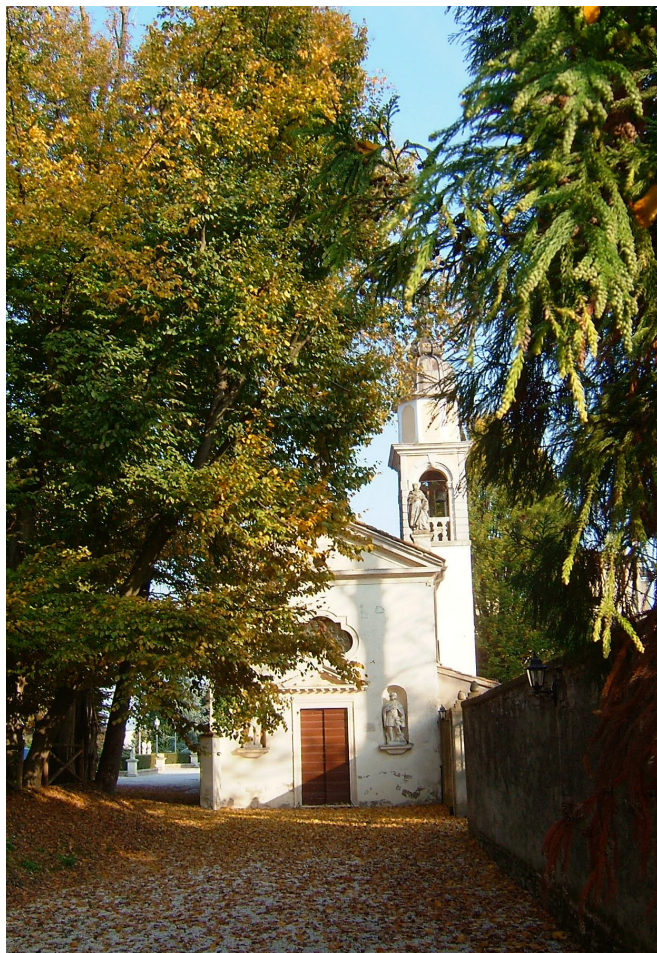
5 Villalta di Gazzo Padovano (Padova), Oratorio dei Santi Giuseppe, Paolo e Carlo di Villa Guzzo-Beretta (ora Tacchi), prospetto sulla via pubblica. 2014.