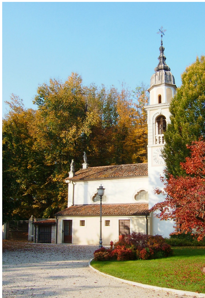
6 Villalta di Gazzo Padovano (Padova), Oratorio dei Santi Giuseppe, Paolo e Carlo di Villa Guzzo-Beretta (ora Tacchi), fianco sinistro con affaccio sulla corte interna del complesso di villa. Fotografia di Giorgia Cestaro, 2014.

parte del committente della chiesetta; nel caso in cui l'oratorio fosse stato soltanto benedetto – e non consacrato – si richiedeva una subventio , distinta dalla dote in quanto non era perpetua, ma concessa dal vescovo a titolo temporaneo. 19 L'oratorio pubblico, così come definito dalle norme canoniche, non sembra distinguersi molto dalle chiese vere e proprie, e per questo motivo risultavano costanti le tensioni e i conflitti di interesse tra chiese parrocchiali e oratori. La norma e la consuetudine prevedevano che i pubblici oratori prossimi a essere eretti non dovessero in alcun modo recare danno alle altre chiese già esistenti, in particolar modo a quelle parrocchiali. Motivo di preoccupazione e contesa tra chiese e oratori era costituito dall'adempimento al precetto festivo, che il Concilio di Trento – attraverso il già menzionato decreto De observandis et evitandis in celebratione Missae – aveva esortato a far rispettare nelle chiese parrocchiali. Nonostante questa fosse la regola, negli oratori non era raro che fosse autorizzata, da parte della stessa autorità vescovile, la celebrazione domenicale. Entrando nel merito del rapporto tra chiesa parrocchiale e oratori pubblici, in questi ultimi erano ammesse solo le messe e non le altre funzioni riservate alle parrocchiali. Al fine di redimere l'eterna controversia, con un decreto del 10