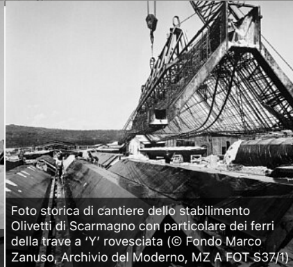
Foto storica di cantiere dello stabilimento Olivetti di Scarmagno con particolare dei ferri della trave a 'Y' rovesciata