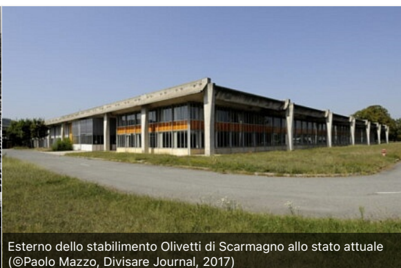
Esterno dello stabilimento Olivetti di Scarmagno allo stato attuale