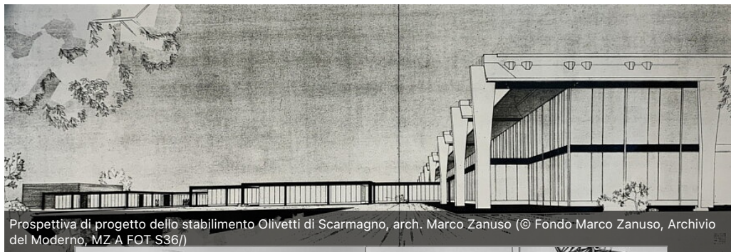
Prospettiva di progetto dello stabilimento Olivetti di Scarmagno, arch. Marco Zanuso