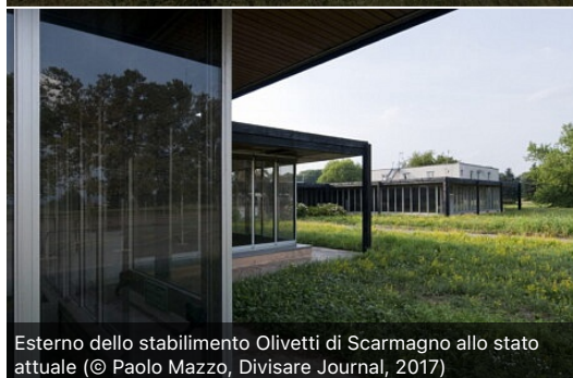
Esterno dello stabilimento Olivetti di Scarmagno allo stato attuale