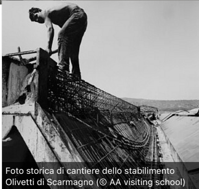
Foto storica di cantiere dello stabilimento Olivetti di Scarmagno