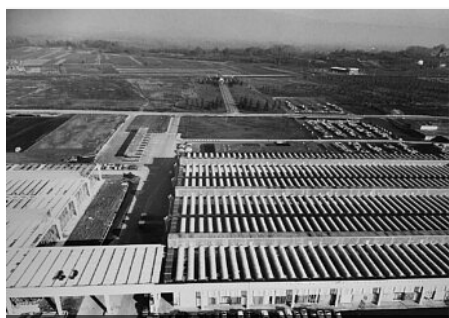
Vista aerea dello stabilimento Olivetti di Scarmagno negli anni settanta

Crespi L., Tedeschi L., Viati Navone A. (a cura di), Marco Zanuso. Architettura e design , Officina libraria, Milano 2020