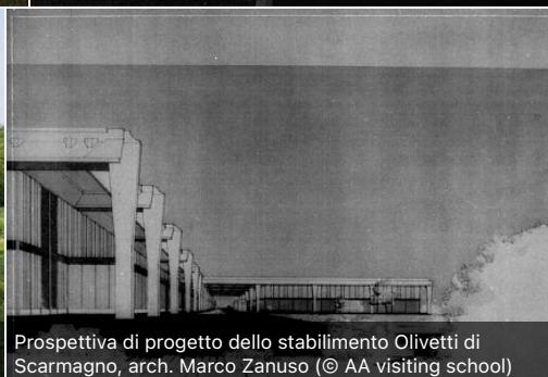
Prospettiva di progetto dello stabilimento Olivetti di Scarmagno, arch. Marco Zanuso