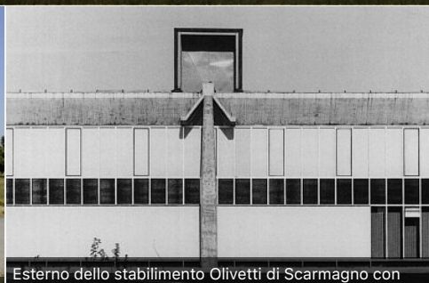
Esterno dello stabilimento Olivetti di Scarmagno con particolare del sistema trave-pilastro a 'Y' rovesciata