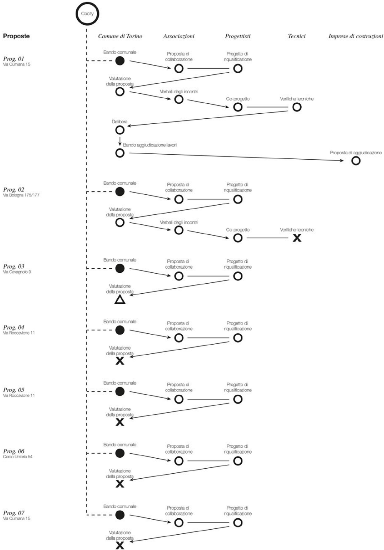
Figura 2. Diagramma comparativo dei progetti che hanno interessato l'attività dell'architetto 3. Ogni pallino rappresenta un documento; in nero quelli verso cui era finalizzata l'azione di progetto dell'architetto 3.