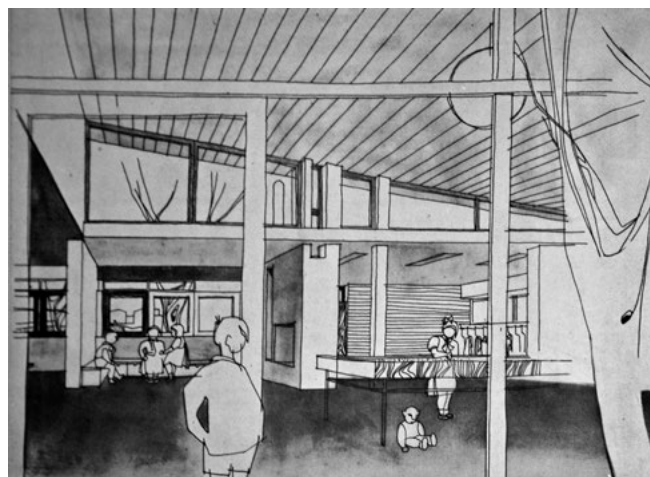
Figura 3. Veduta della sala comune per attività libere e le attività ordinarie, delle nicchie per il gioco di gruppo e dello spogliatoio. Dal quaderno del Centro Studi per l'Edilizia Scolastica dedicato alle scuole materne.

scuole formate da piccoli edifici distribuiti su un terreno piuttosto vasto 25 , sia che queste scuole assumano un assetto più compatto, si iniziano a ipotizzare edifici modulari che permettano una futura espansione. Inoltre si consiglia la