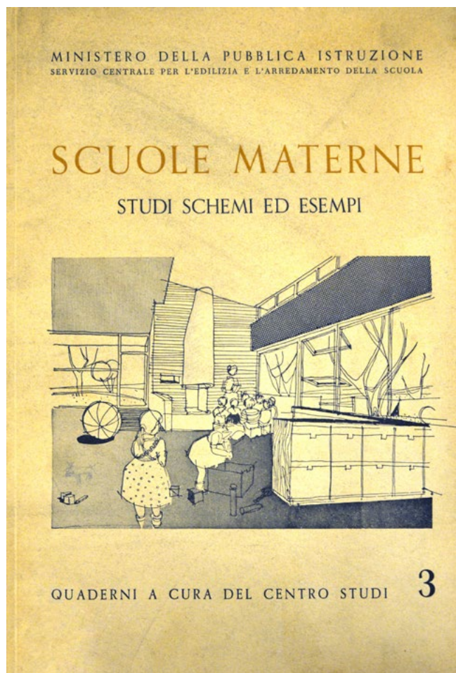
Figura 2. Il quaderno de Centro Studi per l'Edilizia Scolastica dedicato alle scuole materne.

Lo scopo dichiarato del regolamento era «seppellire l'insegnamento passivo e le scuole a blocco monumentali» 24 favorendo così l'affermazione, almeno nel dibattito pubblico, un nuovo ruolo dell'edificio scolastico all'interno della città: sia che la composizione delle unità funzionali si traduca in