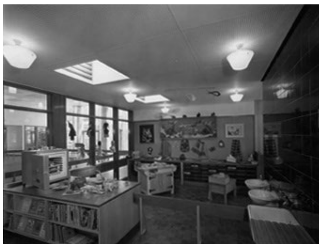
Figura 4. Aula della Scuola elementare progettata dall'architetto W. D. Lacey, costruita nel parco Sempione nei pressi del Palazzo dell'arte in occasione della XII Triennale di Milano.

Le crepe nel processo di applicazione di queste norme tuttavia non tardano a farsi notare. È la XII Triennale di Milano che, a quattro anni dall'approvazione delle norme, riporta il dibattito sotto i riflettori dell'opinione pubblica. La mostra