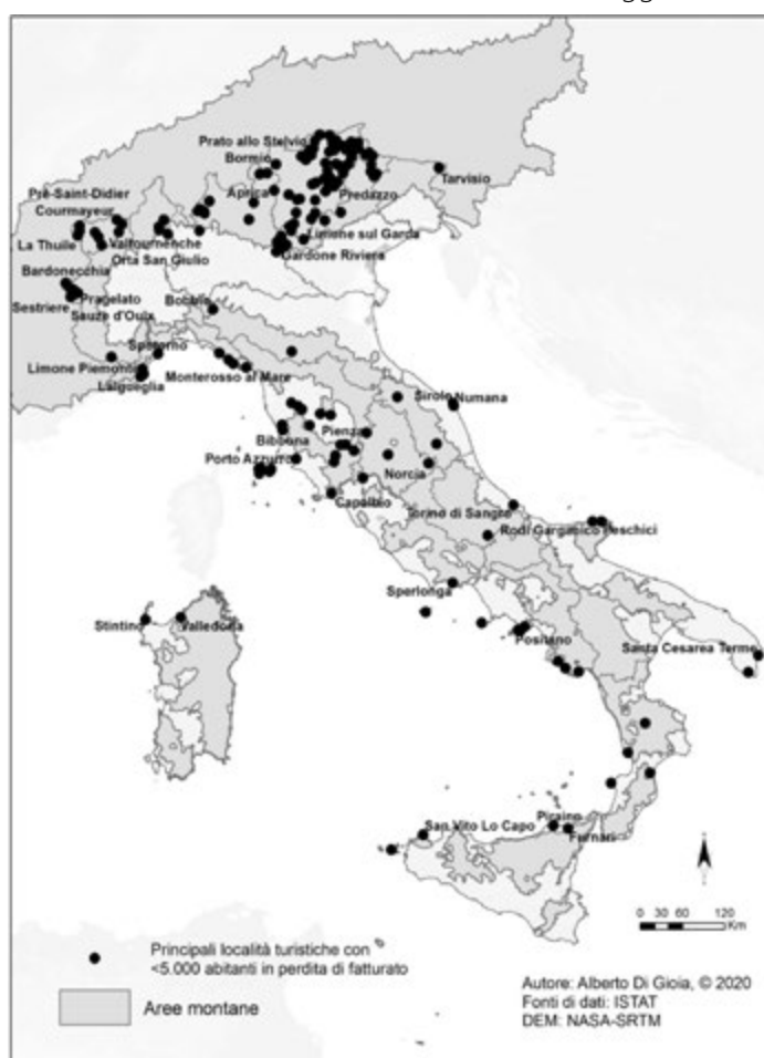
Figura 1. Principali Comuni italiani, con meno di 5.000 abitanti, specializzati nel turismo e con perdite di fatturato in servizi, nel periodo di lockdown per Covid-19, superiori ai 12 milioni di euro.

Per andare più a fondo sulla questione si è condotto un esame più dettagliato sui Comuni delle Alpi Occidentali.