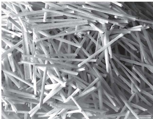
Fig. 3. Le fibre "Alcali Resistenti Spritz-filcem60AR". "Alcali Resistenti Spritz-filcem60AR" fibers.

elastico a trazione assimilabile a quello ottenibile con fibre in acciaio (ma, a differenza di queste ultime, sono caratterizzate da un'elevata resistenza agli agenti aggressivi naturali) e sono caratterizzate da una ottimale dispersione nel calcestruzzo, dovuta ad una assoluta assenza di fenomeni di "aggrovigliamento", in virtù di una particolare combinazione tra rigidità flessionale della macro-fibra e rapporto lunghezza/diametro equivalente della fibra stessa.