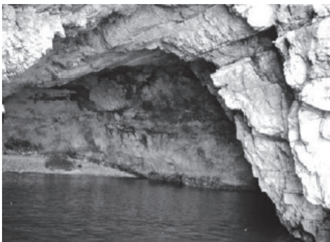
Fig. 2. Spiaggia interna alla grotta Palazzese, sito del crollo del 2006.

Pertanto, per stabilizzare e proteggere la grotta mari-