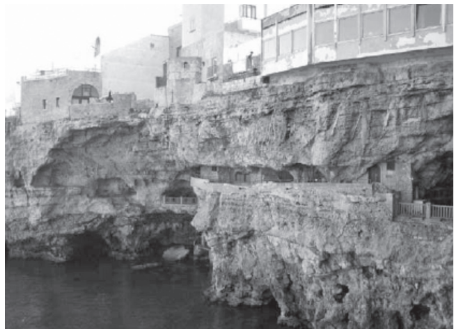
Fig. 1. La Grotta Palazzese. The Palazzese sea cave.

Situata al di sotto del centro storico del Comune di Polignano a Mare, la grotta in oggetto è costituita da due ambienti semicircolari, dei quali il maggiore presenta un diametro di circa 30 m e un'altezza media di 20 m s.l.m.; l'accesso è consentito sia da terra, attraverso due scalinate (la prima antica e risalente al IX secolo e la seconda posta all'interno dell'albergo "Grotta Palazze-