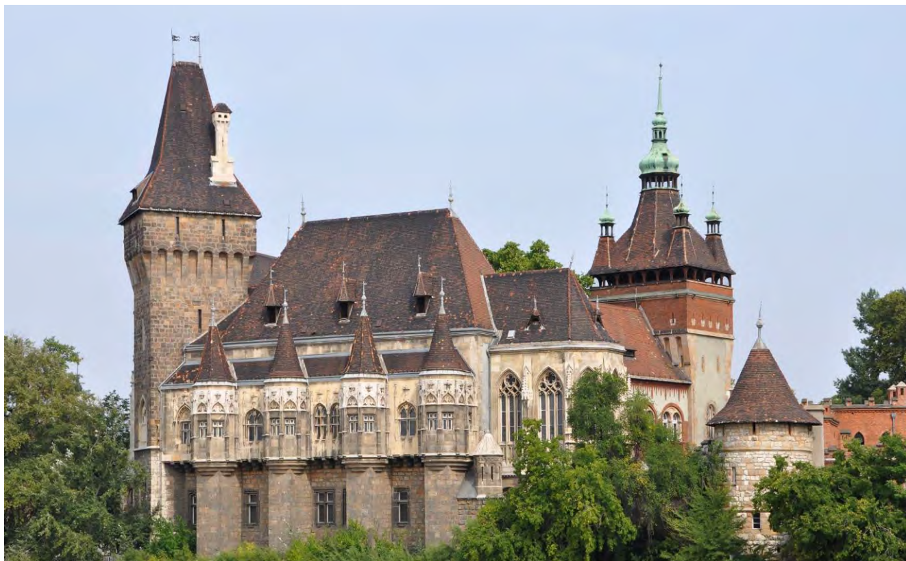
3: Il Vajdahunyad nel Városliget (Ignác Alpár 1896, 1907).

presenta tutti i conseguimenti dell'Ungheria ed è una grande vetrina per dimostrare la modernità del Paese.