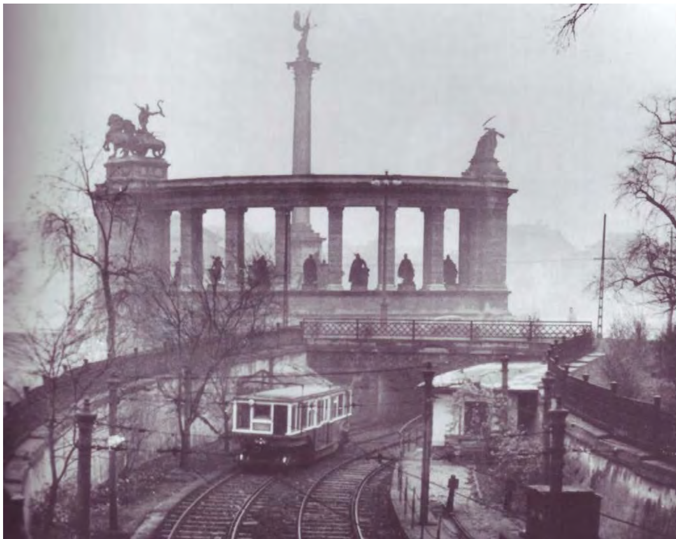
4: L'emersione della metropolitana elettrica (1896) nei pressi del monumento al Millennio, s.d. ma prima metà XX secolo. Wikimedia Commons.

Al centro della piazza su di un'altissima colonna si staglia l'arcangelo Gabriele reggendo la croce apostolica e la Santa Corona, mentre alla base si assiepano i capi delle sette tribù magiare arrivate mille anni prima. Nel 1928 lo scultore Zala terminò le raffigurazioni equestri dei sette capi tribù magiari, a cui venne aggiunto un monumento all'eroismo degli ungheresi durante la guerra, una sorta di grande lastra tombale con incise le date 1914-1918 e la frase «Dedicato ai millenari confini nazionali», sconvolti, com'è noto, nel 1920. La piazza al fondo del viale Andrásy ricevette il nome di piazza degli Eroi nel 1932.