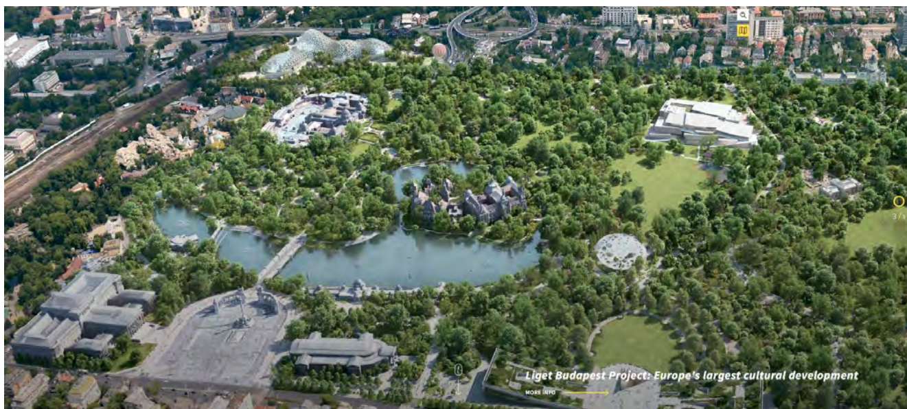
5: Veduta generale del Városliget secondo il progetto di trasformazione. In alto a destra la nuova Galleria Nazionale. Liget Budapest Project, https://ligetbudapest.hu/en/about-the-project .

La ricostruzione del Museo dei trasporti come Museo dell'Innovazione (Studio di Architettura Mérték) che riproponeva l'architettura di Ferenc Pfaff ridotta ai minimi termini dalla guerra e dalle seguenti demolizioni è stata bloccata, così come è stata fermata la costruzione del cuore del sistema, la nuova Galleria Nazionale (Sanaa, Bánáti + Hartvig). Il tutto è finito in un braccio di ferro tra governo nazionale e governo della capitale, di segno opposto. Il progetto del nuovo Városliget, visto dai promotori come un nuovo specchio della nazione – capace di attirare turisti grazie all'offerta museale intrecciata a quella dello zoo ampliato con il Pannon Park e del parco rinnovato –, è invece osteggiato da molte componenti politiche e sociali per il peso dato alle costruzioni in un'area verde. Il blocco alla costruzione della nuova Galleria Nazionale è stato sancito dal Consiglio Municipale di Budapest il 5 novembre 2019, nel tentativo di spostare il museo in un'area meno sensibile, come documenta The Architect's Newspaper [Stone 2019]. I cosiddetti 'Difensori del parco' nel 2018 hanno celebrato i due anni di permanenza, con tende, nel parco stesso. La battaglia politica emerge nel sito del progetto, che documenta petizioni nazionali con 50.000 firme per appoggiare il completamento del piano.