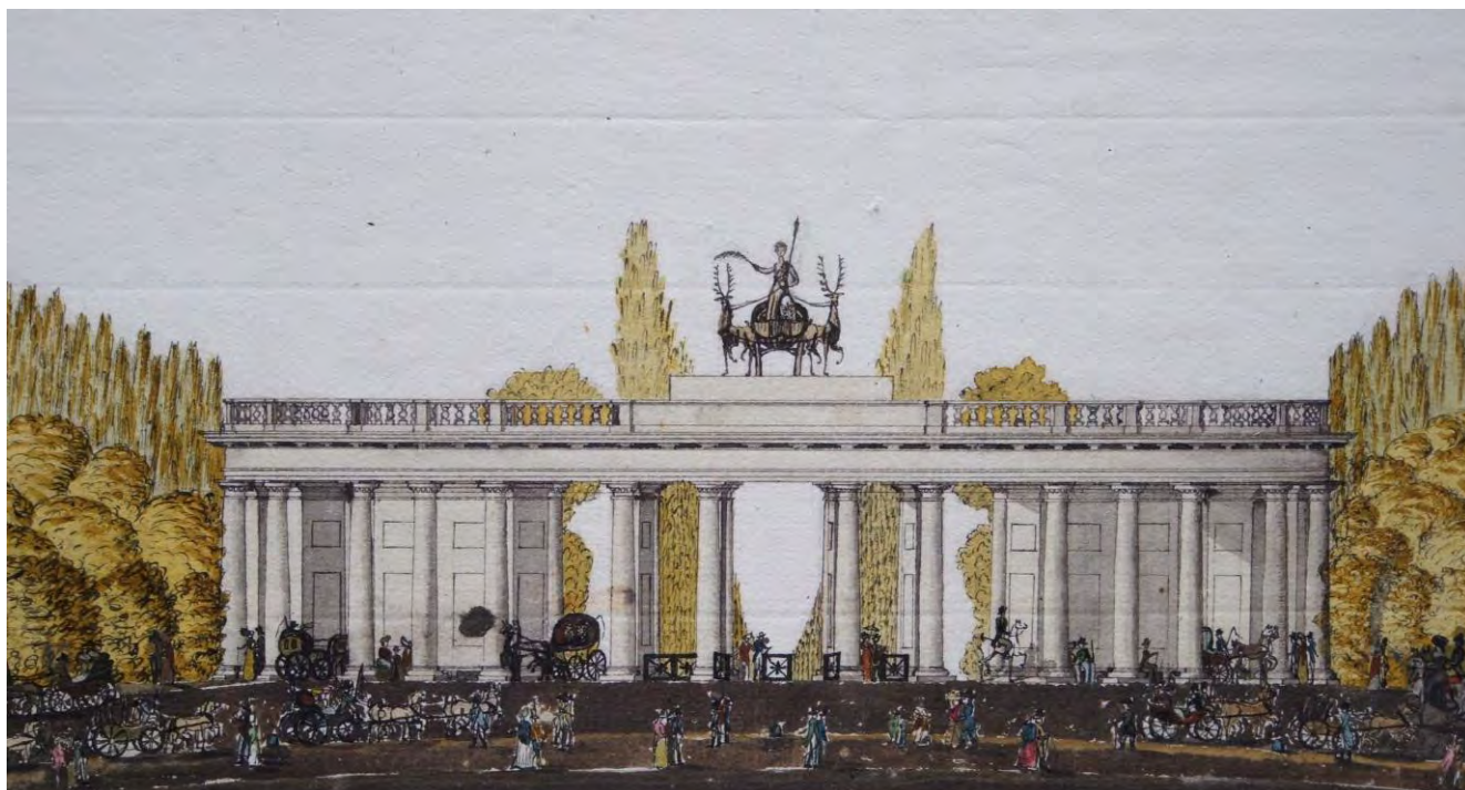
1: Heinrich Nebbien, Ungarns Volks-garten der königlichen frey-stadt Pesth , s.d. ma 1816, tav. V, Elevation vers le Cirque / Pris du fond opposite du Cirque , dettaglio (Budapest, Történeti Múzeum, Kiscelli Gyűjtemény).