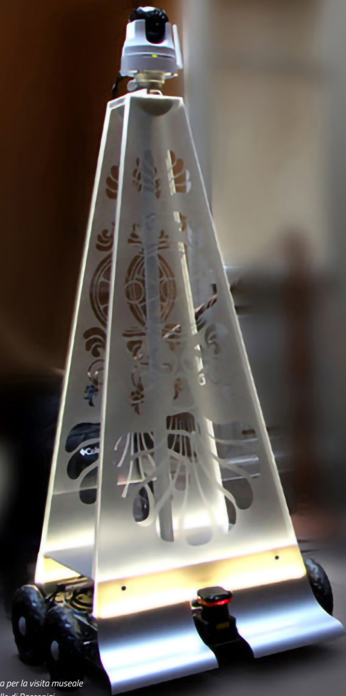
Fig. 1. Virgili, robot di telepresenza per la visita museale degli spazi inaccessibili del Castello di Racconigi.