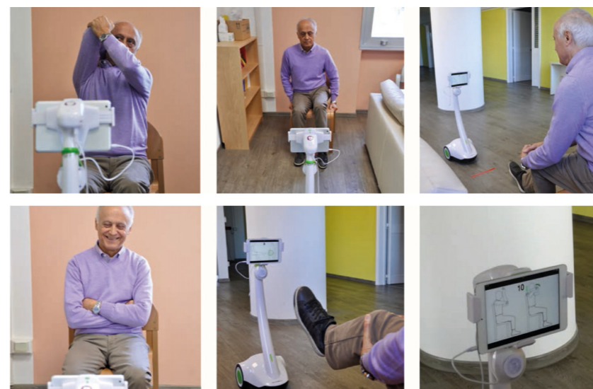
Fig. 3. Immagine tratta dallo Studio MoDiPro (Modello organizzativo, architettonico, tecnologico di DImmissione PROtetta per soggetti anziani) condotto dal Dipartimento Architettura e Design dell'Università degli Studi di Genova insieme all'E.O. Ospedali Galliera di Genova.