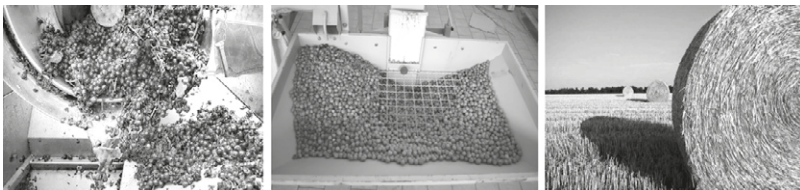
Figura 1 – Scarti della filiera vitivinicola (SX), corilicola (C) e cerealicola (DX) [Elaborazione J. Andreotti].

Lo studio delle filiere di uva, nocciola e frumento è stato condotto attraverso un approccio metodologico rivolto alla comprensione delle fasi che generalmente caratterizzano la produzione "lineare", cioè in assenza di processi finalizzati al recupero e riciclo della materia: dal campo, alla raccolta, ai processi di lavorazione, fino al prodotto finito. Cruciale in tal senso è stata l'indagine effettuata sui processi che generano scarti (output), individuando in particolare la tipologia, le percentuali e i quantitativi potenzialmente disponibili (tab.1). Per stimare la