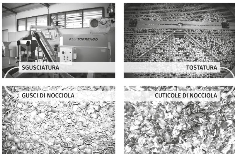
Figura 2 – Lavorazioni e scarti nocciola [Elaborazione J. Andreotti].

disponibilità di scarti a scala regionale, sulla base della produzione media di prodotto finito, sono stati assunti come riferimento dati ISTAT (Istituto Nazionale di Statistica), ENAMA (Ente Nazionale Meccanizzazione Agricola) e dati desunti dalla ricerca di parole chiave sul web