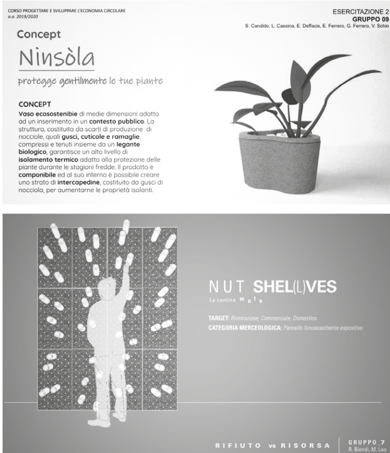
Figura 4 - Scenari di riuso di cuticole e gusci proposte dagli studenti [Elaborazione degli studenti].

Per quanto attiene la cuticola di nocciola, sono stati sperimentati dei