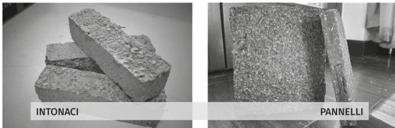
Figura 5 - Provini di intonaci e pannelli realizzati con scarti di nocciole [Elaborazione J. Andreotti].

Sono anche segno evidente di nuove sfide che architetti e designer dovranno affrontare in futuro - come prevedere possibili usi di rifiuti e scarti o valutare gli impatti ambientali di nuovi processi e prodotti realizzati a partire da materie prime seconde - e di nuovi ruoli che dovranno rivestire, agendo come "direttori di orchestra" tra gli attori e incoraggiando approcci interdisciplinari al progetto.