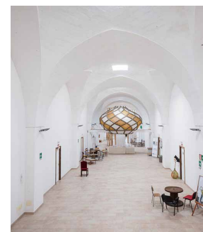
Fig. 1 Recupero dello stabilimento enologico Dentice di Frasso. (Foto di A&R Tartaglione - Rielaborazione degli autori, 2020)