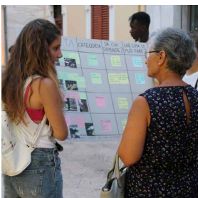
Fig. 2 Incontri del processo partecipato di rigenerazione urbana Santu Vitu Mia (Rielaborazione degli autori, 2020)