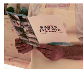
Fig. 3 Promozione del processo partecipativo di rigenerazione urbana Santu Vitu Mia Reloaded (Rielaborazione degli autori, 2020)