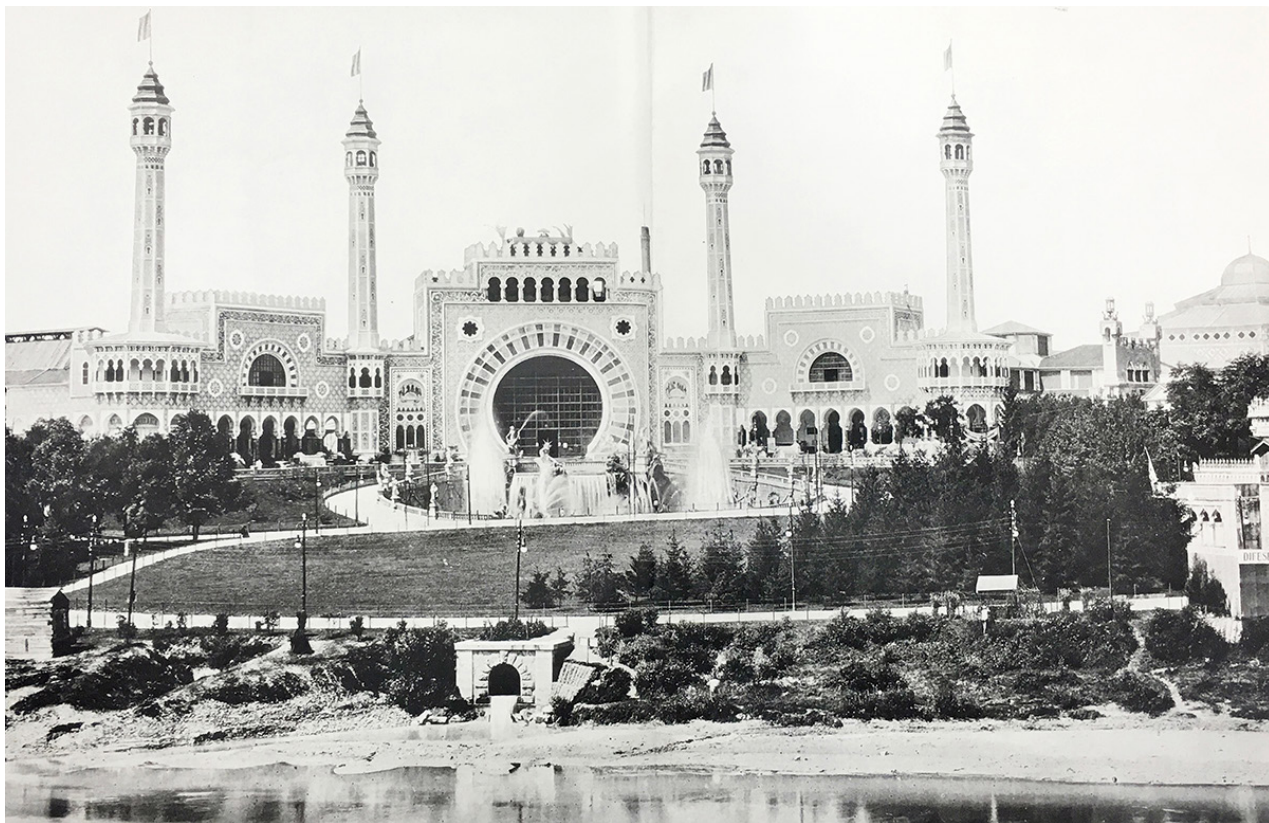
Figura 3. La triplice facciata dell'Esposizione 1898 (Sacheri 1900, tav. XI)

ci della ultima fortunata Mostra indetta a Torino per il cinquantenario dello Statuto. E i tre architetti, rispondendo volentieri e concordi all'appello, non vennero meno alla loro fama creando un edificio così imponente e fastoso, quanto gaio e gentile, tale da lasciare a distanza i padiglioni, le gallerie e le facciate del 1898. (Frizzi 1900, 6)