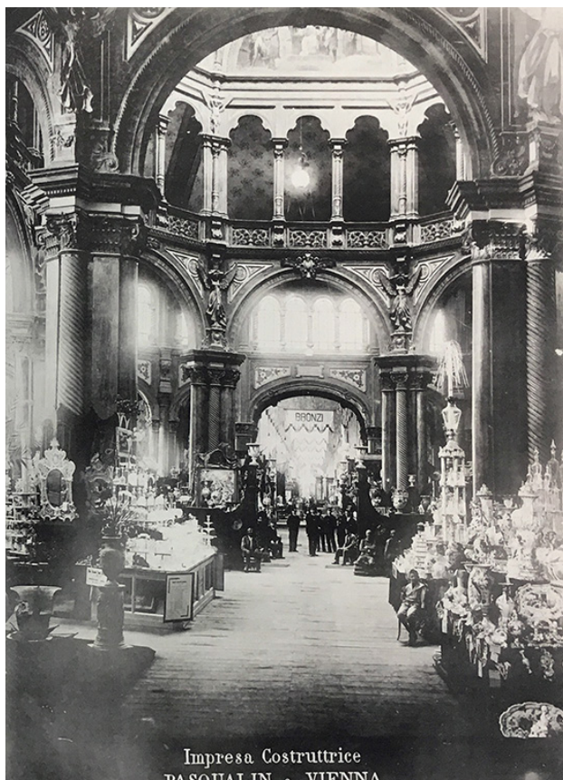
Figura 2. Il salone Ottagono dell'Esposizione 1898 (Sacheri 1900, tav. VI)

tura o, ancora, nel padiglione Ottagono (fig. 2) progettato da Salvadori in «stile da Esposizione» (Sacheri 1900, 36) e nel cavalcavia loggiato della Concordia progettato da Gilodi, elemento di giuntura tra l'Esposizione Generale e l'Esposizione dell'Arte Sacra, delle Missioni Cattoliche e delle Opere di Carità a emblema della collaborazione tra autorità laica ed ecclesiastica nella programmazione delle manifestazioni.