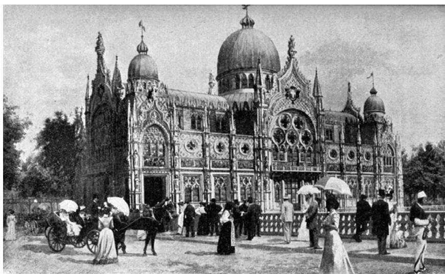
Figure 4-5. Due vedute del padiglione italiano all'Esposizione Universale parigina del 1900 ( Exposition internationale 1900 , 25, 122)