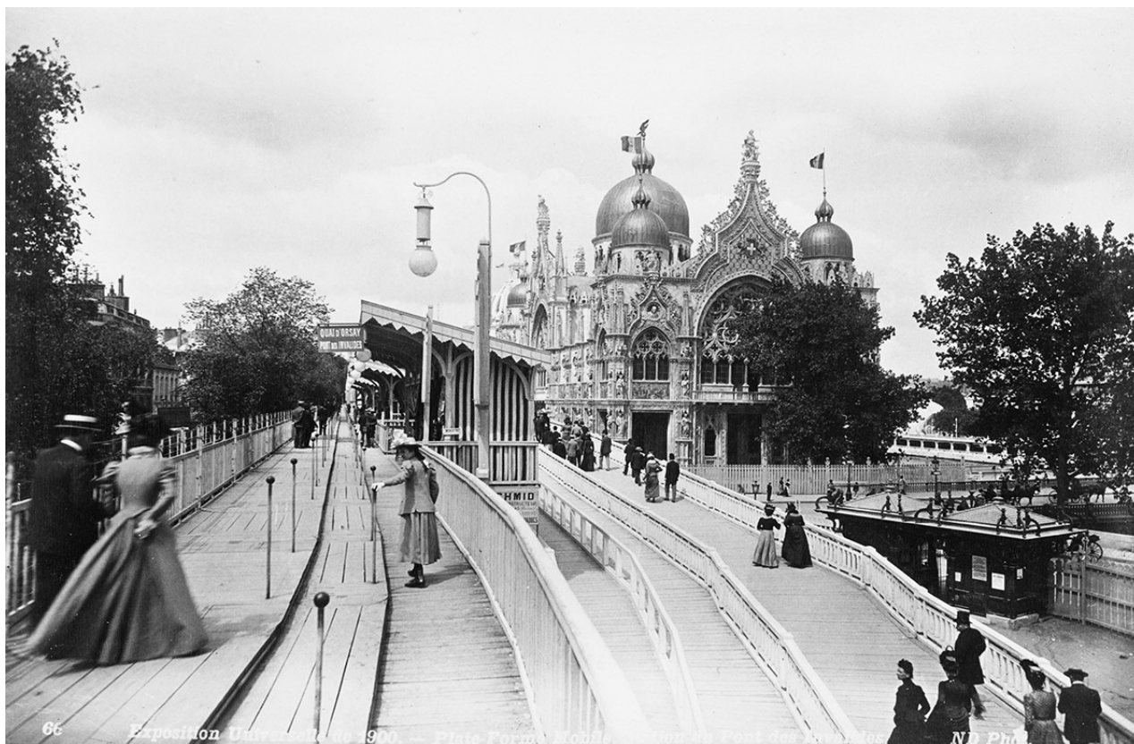
Figura 6. Scorcio del padiglione dal pont des Invalides ( Exposition universelle 1900a )

una cupola. A questa sala s'innestano due bracci quadrati che generano una pianta a croce, che origina, in corrispondenza degli angoli, quattro spazi minori su due piani, separati dalle sale adiacenti mediante arcate sorrette da colonnine. Sul lato ovest è ripreso il medesimo schema compositivo, ma in luogo del vestibolo si sviluppa uno scalone monumentale (affiancato da due sale) che, nel riprendere la scala dei Giganti del Palazzo Ducale di Venezia, conduce al primo piano a una loggia balaustrata che percorre il perimetro dell'edificio (Frizzi 1900, 18-20).