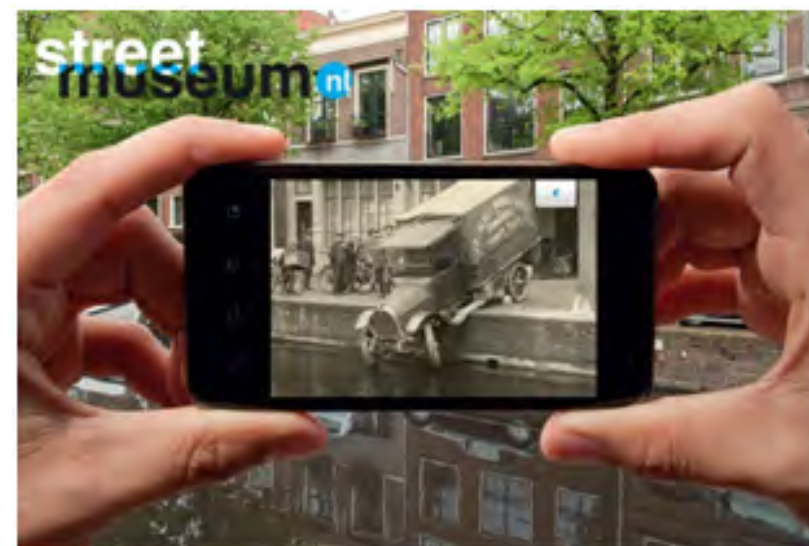
Figura 4. Applicazione per smartphone Streetmuseum , che nell'area settentrionale olandese (Amsterdam e provincia) utilizza le foto d'epoca per sovrapporle allo sguardo sul presente.