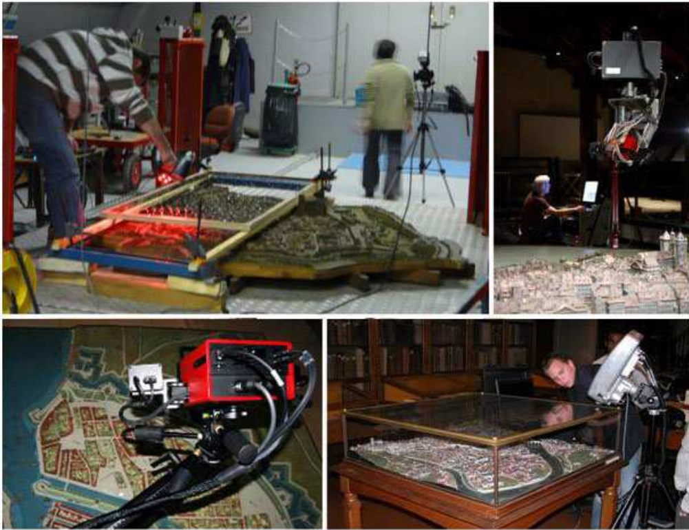
Fig. 2. Alcuni esempi di modelli plastici di città e strumenti di digitalizzazione (Jacquot 2014, p. 41).

Un caso a parte nel panorama europeo è quello francese del museo nazionale dei Plans-reliefs, che conserva un centinaio di plastici di architettura militare costruiti dalla fine del XVII secolo alla fine del XIX secolo, appartenenti ad una collezione che nel 1927 è stata classificata monumento storico. Ad essi si aggiungono una cinquantina di modelli teorici, di tipo pedagogico, realizzati tra il XVIII e il XIX secolo per l'insegnamento nelle scuole militari. Il museo, aperto nel 1943 è attualmente in corso di rifunzionalizzazione, mirata ad espandere lo spazio di visita, fino ad oggi limitato all'esposizione di un solo terzo della collezione.