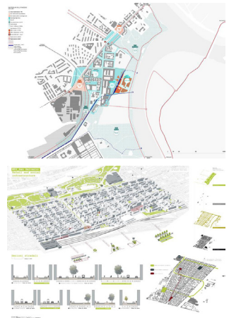
Fig. 1: Fermata MT2 Cimarosa-Tabacchi: "la città del loisir acquatico" come paesaggio costruito soft-tech, tra urbano e periurbano.

L'obiettivo, utilizzando come lente critica il paradigma del built environment , è quello di indagare un tema potenzialmente ricorrente nel prossimo futuro dei nuclei urbanizzati: in che modo una importante infrastruttura per la mobilità, concepita come sequenza di stazioni standardizzate, possa recuperare il suo fondamentale ruolo di agente di rigenerazione urbana dell'intorno, in conseguenza del ribilanciamento che introduce nel policentrismo urbano.