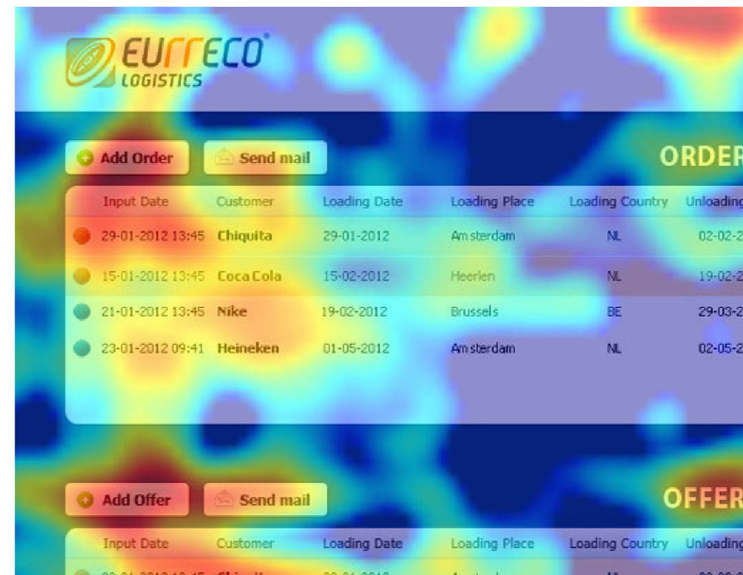
Fig. 3. Heatmap di interfaccia digitale.