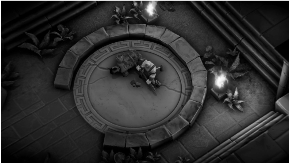
Fig 2. Segundo prototipo digital desarrollado por los estudiantes de DigitalScapes 2017.