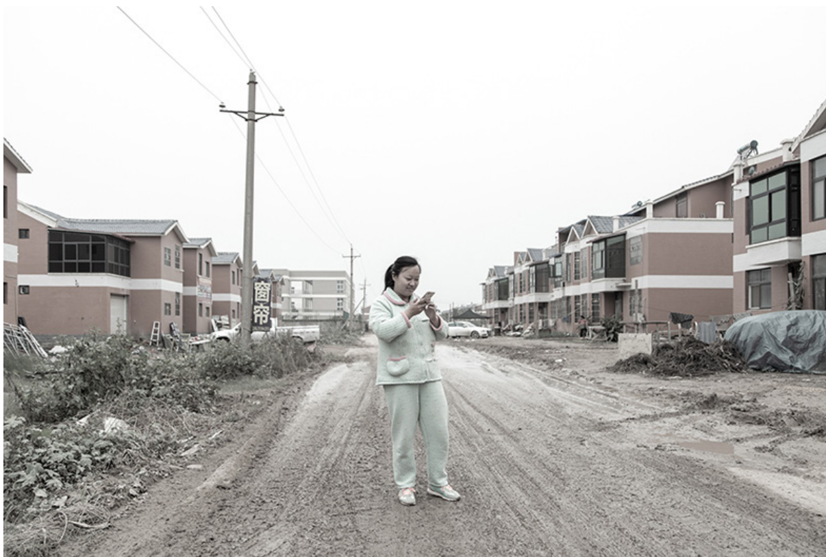
Figura 5 | Villaggio di Zhugu, nord di Zhongmu, 2017, Zhengzhou, Provincia dello Henan. Fonte: fotografia di Samuele Pellicchia (Prospekt Photographers), per la mostra China Goes Urban.

quelle descritte da numerosi autori che recentemente hanno osservato gli spazi della logistica contemporanea, ormai difficilmente considerabili meri spazi tecnici (Easterling, 2016; Lyster, 2016). Al pari di quest'ultimi, le nuove urbanizzazioni cinesi e le infrastrutture che le compongono riscrivono le relazioni di scala non soltanto ridefinendo i rapporti di prossimità, ma ridisegnando anche pratiche sociali (Amin, 2014; McFarlane & Rutherford, 2008). È emblematico a questo proposito il ritratto dalla foto Villaggio di Zhugu, nord di Zhongmu, 2017, Zhengzhou, Provincia dello Henan [fig. 5] in cui una giovane donna residente in un villaggio agricolo usa il traduttore di uno smartphone nel tentativo di comunicare con il fotografo. L'insieme di queste condizioni solleva un ultimo quesito: come possiamo leggere uno spazio, come quello che la pervasività della nuova infrastrutturazione ben descrive, che vuole essere inclusivo, e garante di condizioni di vita simili per il maggior numero possibile di abitanti, e al contempo generatore di frammenti urbani eterogenei?