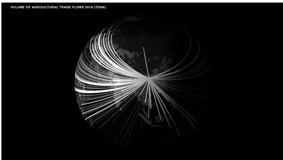
Figura 3 | Fermo immagine del video: Extended Urbanization in China and Beyond.

l'intero globo. Questi ed altri materiali della mostra evidenziano come sia impossibile scindere il processo di urbanizzazione in atto in Cina da storie e contesti altri. Questo è pertanto osservato come parte di un più ampio processo planetario, che tuttavia ha visto lo spazio cinese rivestire un ruolo di primo piano negli ultimi quarant'anni. Questo spazio è di certo straordinario per via delle quantità, tuttavia la mostra ci invita a domandarci quali siano i suoi effettivi caratteri di novità. Cosa scopriamo se estrapoliamo lo spazio in costruzione dalla mistificazione dei grandi numeri? L'ipotesi dei curatori è che così facendo sia possibile cogliere alcuni dei caratteri delle trasformazioni in corso. Tuttavia è bene specificare che non si tratta di una mossa volta ad addomesticare l'oggetto attraverso una sua semplificazione, al fine di ricondurlo, pezzo per pezzo, all'interno di quadri di senso compiuti e noti. Si tratta piuttosto di esaltare le tensioni e i conflitti che si celano oltre l'apparente eccezionalità dei luoghi. Ma a valle di queste tensioni, cosa rimane della città?