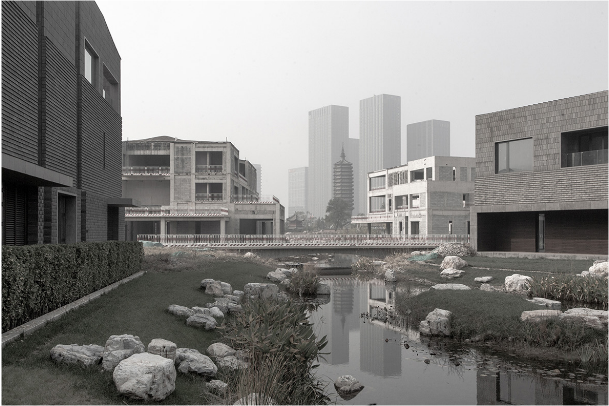
Figura 4 | Ville in costruzione, 2017, Tongzhou New Town, Pechino, Municipalità di Pechino. Fonte: fotografia di Samuele Pellicchia (Prospekt Photographers), per la mostra China Goes Urban.

La mostra non vuol essere una sorta di wunderkammer che espone le mirabilia collezionate. Piuttosto, in riferimento alle parole di Goffredo Parise che accompagnano il percorso della mostra, e che nel libro Cara Cina descrivevano Pechino come un frattale, i curatori invitano ad osservare i frammenti che compongono la città come un insieme di parti ognuna delle quali declina in modo differente al suo interno comuni caratteri dell'urbano.