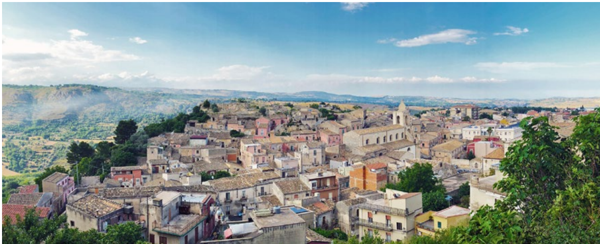
Figura 4. Il territorio di Palazzolo Acreide (Siracusa).

collegamento, classificabili in percorsi natura (lungo il fiume e i sentieri della Valle dell'Anapo), piste ciclabili o pedonali (da realizzarsi lungo la ferrovia dismessa) e percorsi di collegamento (infrastrutture stradali esistenti), così come i centri servizi, collocati lungo la rete, presso le stazioni dismesse della rete ferroviaria. Il primo cluster (C1) prevede la realizzazione di fattorie didattiche presso le masserie, strutture ricettive nelle ville e parchi tematici da insediare nei mulini ad acqua. Nel secondo (C2) sono previsti, invece, centri di ricerca per il settore agricolo nelle masserie, centri di promozione del Val di Noto presso le ville e esposizioni-mercato dei prodotti tipici nei mulini ad acqua. La scelta del cluster più adeguato alle esigenze locali è stata effettuata mediante una valutazione multicriterio 35 che ha coinvolto i principali stakeholders locali, consentendo di valutare la capacità di ciascuna ipotesi di tutelare l'identità del territorio mediante un'opportuna selezione di criteri e indicatori 36 . Il risultato ottenuto ha condotto a selezionare l'ipotesi di cluster territoriale C1 quale ipotesi preferibile.