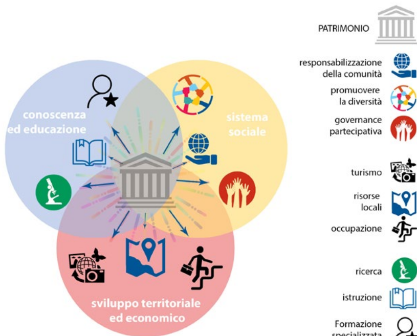
Figura 1. Il modello di valorizzazione e gestione proposto dalla Strategia per il Patrimonio Culturale Europeo per il 21° secolo (elaborazione di M.R. Pinto, D. Bosia, S. De Medici).

numero di visitatori censiti: 103.888.764 totali (dei quali risultano paganti il 52,82%) e 13.868.793 (paganti il 52,89%) nei luoghi della cultura situati in aree interne: a fronte di un patrimonio che rappresenta circa un quarto di quello nazionale, i fruitori che visitano siti culturali nelle aree interne sono circa il 10% del totale nazionale.