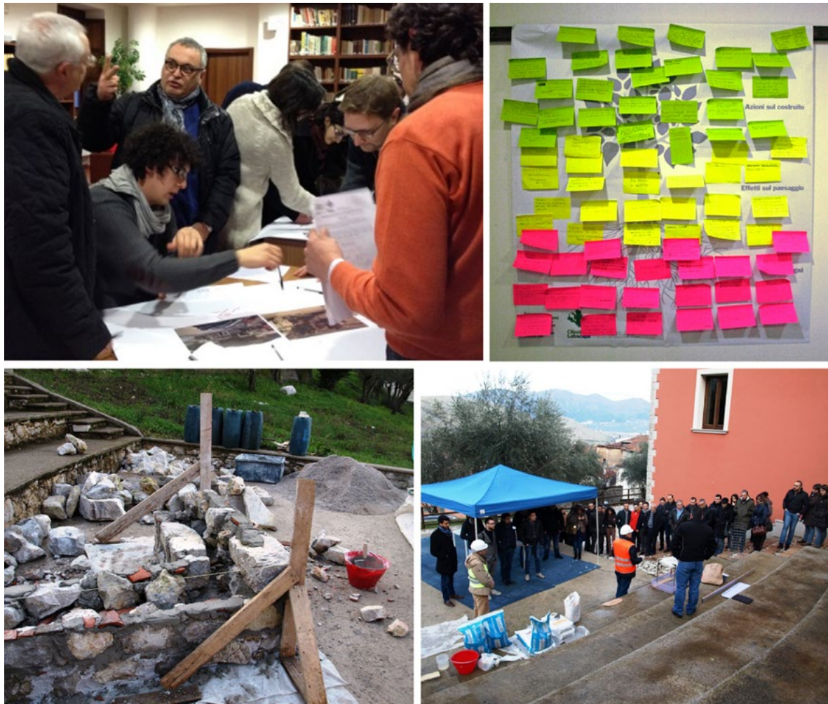
Figura 3. Le attività del Living Lab di Sassano.