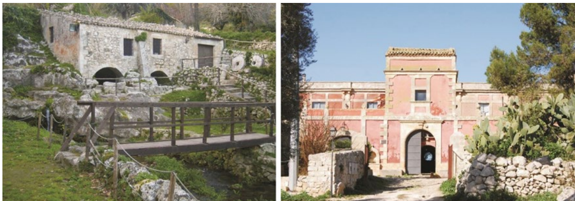
Figura 5. Il patrimonio costruito tradizionale dell'area di Palazzolo Acreide: Mulino Santa Lucia e Villa Bibbia.