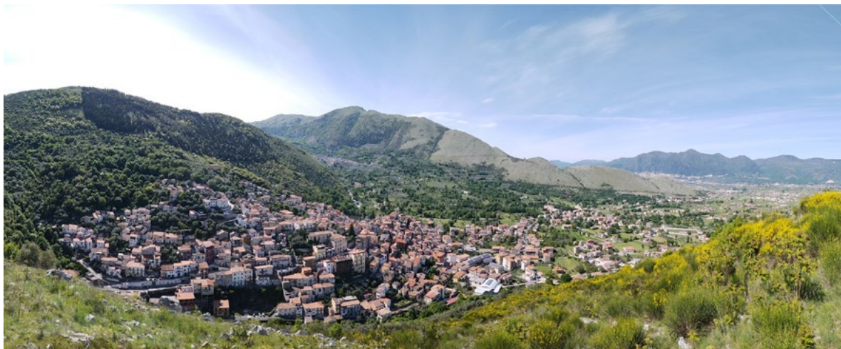
Figura 2. Il territorio di Sassano (Salerno).

tema dei valori documentari e dell'affermazione dell'utilità collettiva dei paesaggi storici 27 . I piccoli insediamenti sono oggi riconosciuti non solo come il prodotto di vicende politiche, economiche e sociali, ma anche come il risultato di un costante impegno nello sviluppo di una cultura costruttiva radicata nel territorio 28 .