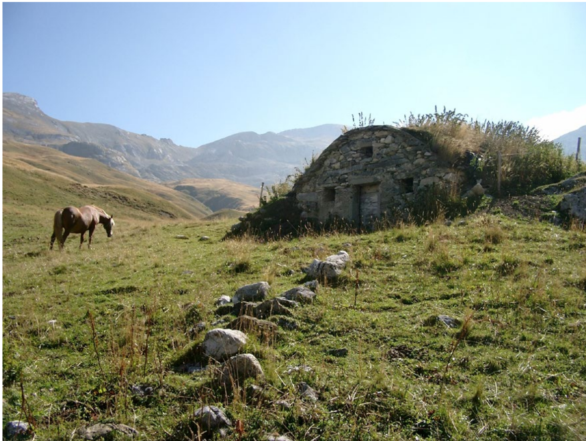
Figura 8. Alpeggio nell'area G.A.L. Mongioie, con locale per la conservazione dei latticini, detto "sella" o "truna".