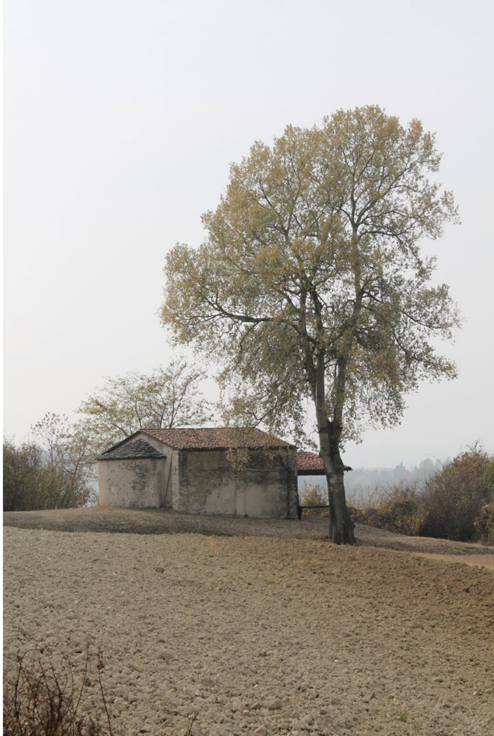
Figura 7. Il G.A.L. ha promosso in precedenti programmazioni interventi come il recupero su cappelle rurali diffuse a rete e strutturate su un sistema di assi (viabilità principale e secondaria) e nodi (piazze pubbliche delle borgate e villaggi). Per garantirne la fruizione pubblica e turistica nell'attuale PSL il G.A.L. prevede di adottare piani di gestione affidati a privati, come le aziende agricole ed eno-gastronomiche.