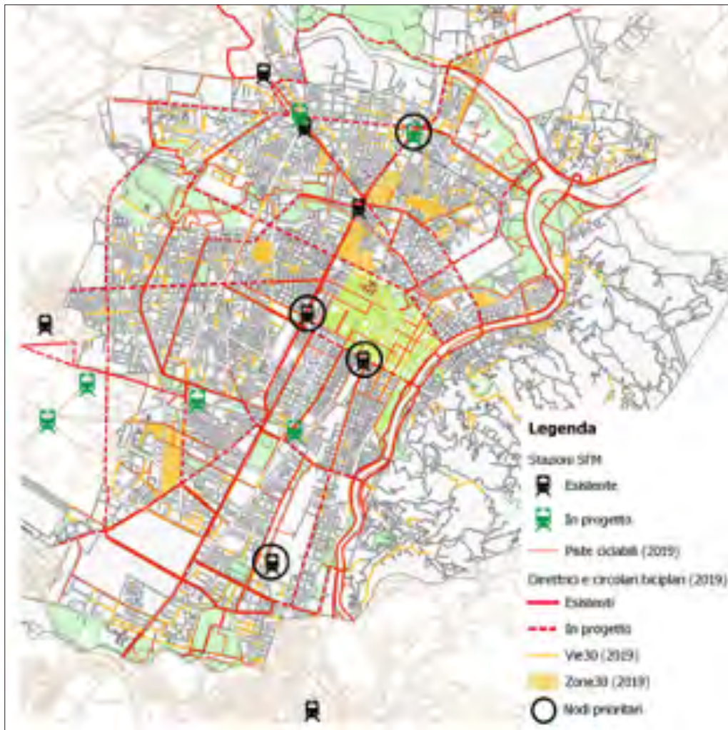
Figura 1 – Individuazione dei nodi ritenuti prioritari e strategici per la realizzazione di bicistazioni. Elaborazione su dati Comune di Torino.

Lo studio è volto ad integrare questo sistema di iniziative, fornendo prime indicazioni per la collocazione di una o più ulteriori ciclostazioni a supporto dell'intermodalità. A partire dall'analisi dello stato di fatto e di progetto relativo a reti, nodi, utenza e flussi della mobilità ciclabile e del pendolarismo, lo studio ha fornito orientamenti in merito ai nodi prioritari (Figura 1), nonché prime indicazioni funzionali, tipologiche, dimensionali e gestionali.