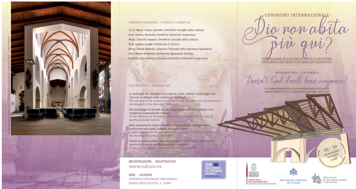
Fig. 01. Anverso del folleto del simposio « Dio non habita più qui? », celebrado entre el 29 y el 30 de noviembre de 2018 en la Pontificia Universidad Gregoriana, Roma (Italia).

El documento está estructurado en cinco capítulos: 1. El contexto sociopastoral del abandono de las iglesias; 2. La esfera del derecho canónico; 3. Puntos para la reflexión en las normas internacionales sobre patrimonio cultural; 4. Criterios de orientación para la herencia de edificios sagrados; 5. Pautas para el patrimonio móvil: mobiliario, accesorios y patrimonio asociado que no sean edificios, seguido de once recomendaciones finales.