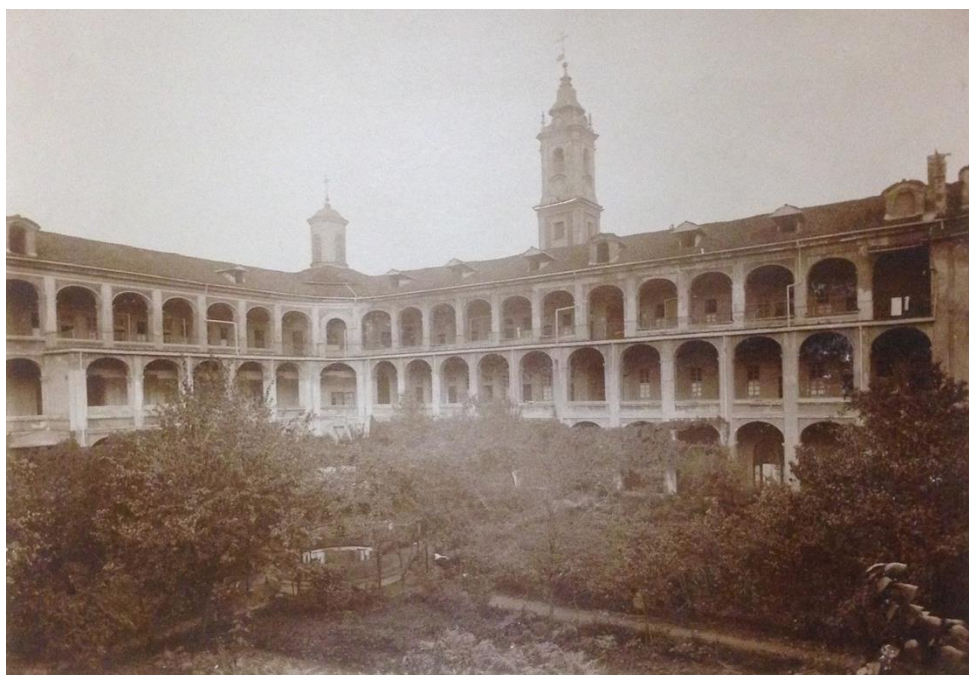
Fig.1 – Torino, il chiostro del convento della Visitazione, già di Santa Chiara, inizio XX secolo