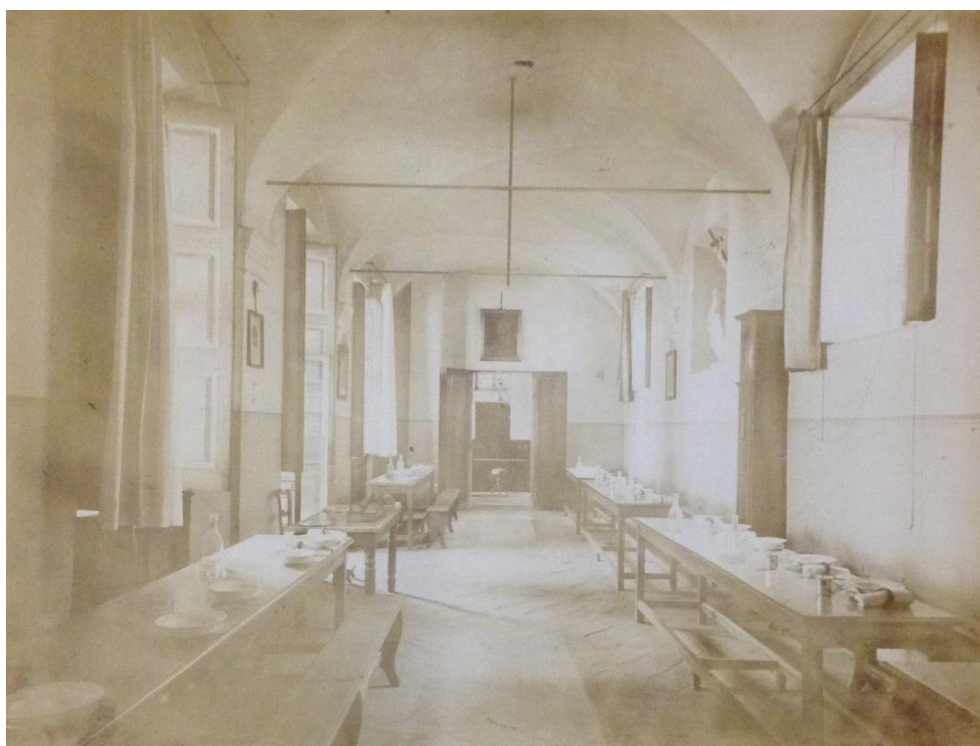
Fig. 2 – Torino, il Refettorio delle educande - cameretta del piano, convento della Visitazione, già di Santa Chiara, inizio XX secolo