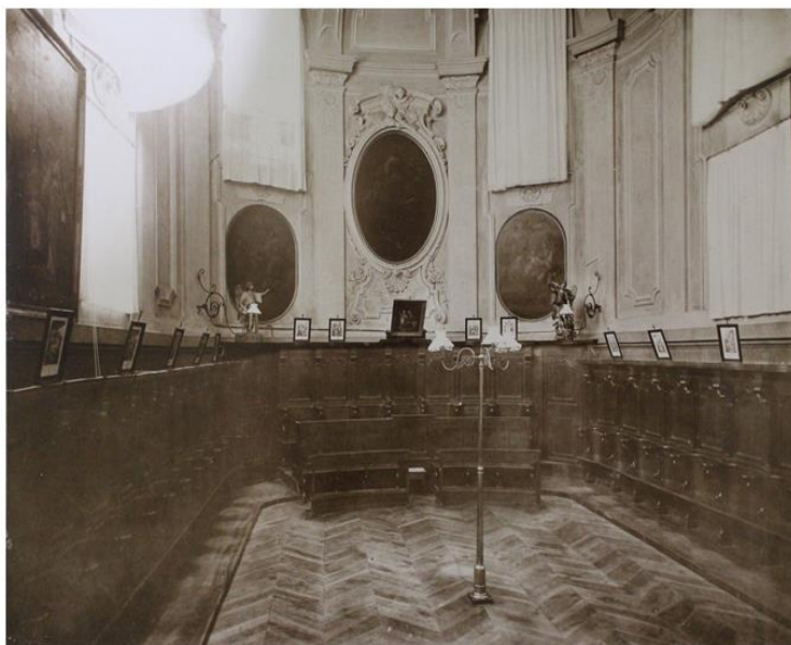
Fig. 5 – Torino, il coro del convento della Visitazione, già di Santa Chiara, inizio XX secolo