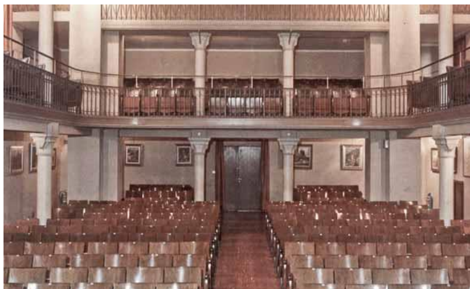
Fig. 13 – Il Teatro Juarra (oggi Le Musichall) interno al Collegio degli Artigianelli, prima dell'intervento di restauro