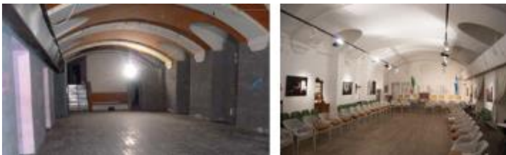
Fig. 17 – Spazio ex Procope