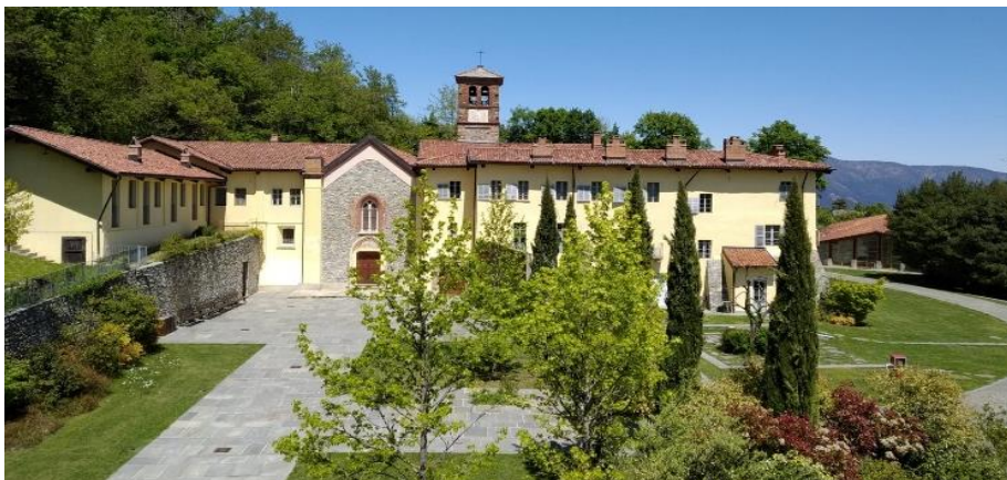
Fig. 21 – Avigliana (TO), certosa dopo l'intervento di restauro

Con riferimento al processo di riuso, il rispetto del bene si è manifestato non solo in termini di compatibilità architettonica ma anche alla luce di un più ampio concetto di sostenibilità allargata agli aspetti economici, sociali e culturali. Dal punto di vista più strettamente economico, la rifunzionalizzazione ha trasformato un complesso sottoutilizzato in un bene finanziariamente autosufficiente, con un incremento dei posti di lavoro e dei visitatori culturali nel contesto di un turismo sostenibile (46).