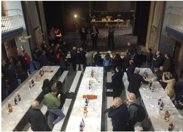
Fig. 14 – Un uso insolito per la platea del Teatro Javarra: pranzo di Natale 2016 per le maestranze impegnate nel cantiere del parcheggio