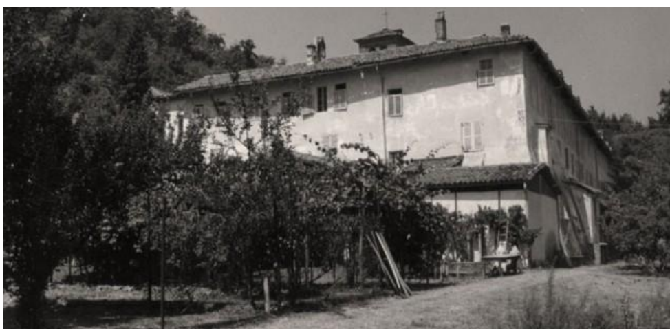
Fig. 19 – Avigliana (TO), certosa durante la presenza delle monache certosine, s.d.

restaurare il complesso attraverso la costituzione dell'Associazione Abbazia 1515 Onlus (ora Associazione Certosa 1515 Onlus) presieduta da don Luigi Ciotti. L'obiettivo perseguito era garantire la continuità di vita del bene, non solo in termini di compatibilità architettonica ma anche di conservazione dello "spirito del luogo" (32). In tal senso, la filosofia del progetto, denominato Ex-co , poneva a fondamento alcuni valori riconducibili proprio alla sillaba "co" ( coerenza, conoscenza, convivenza, corresponsabilità, condivisione, complessità, coraggio, concretezza e continuità ) (33).