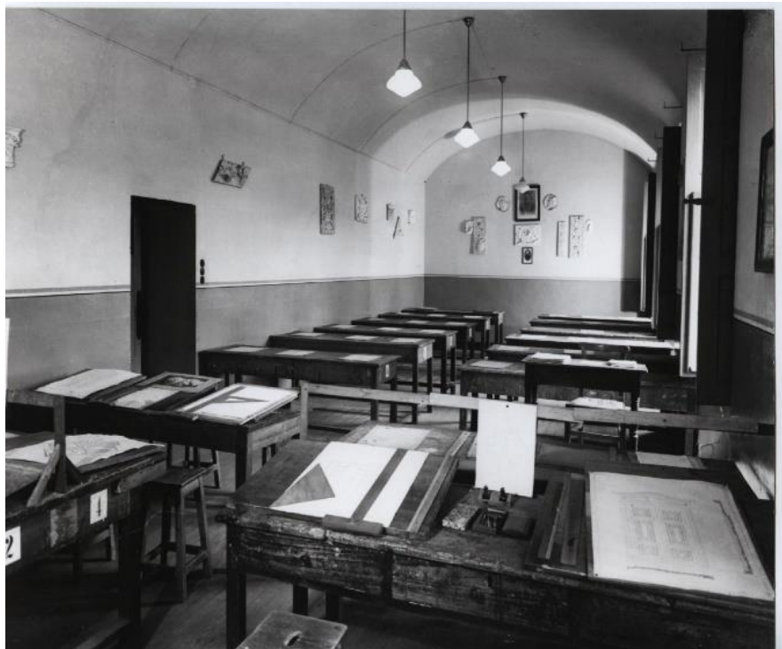
Fig. 8 – Aula per il disegno, foto storica