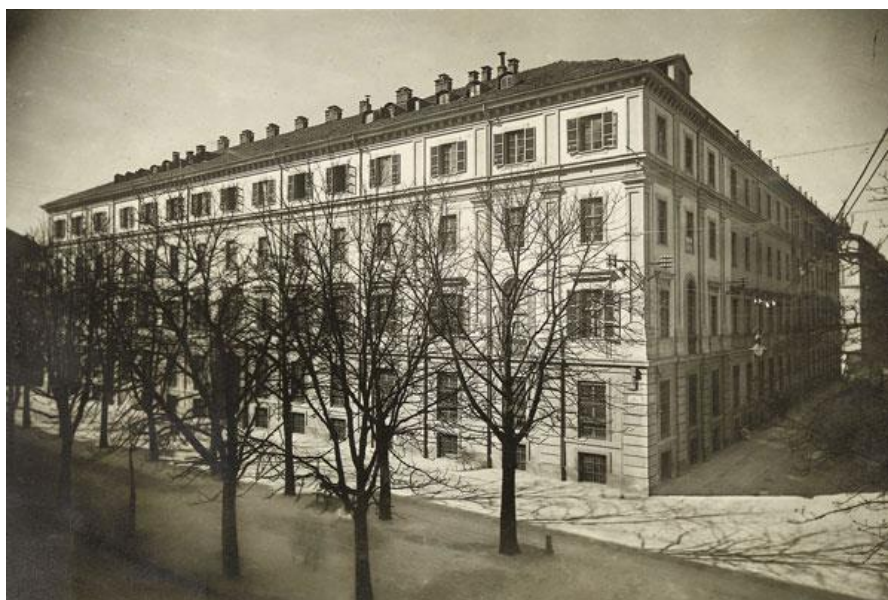
Fig. 7 - Collegio degli Artigianelli, vista d'angolo via Palestro, via Juarra