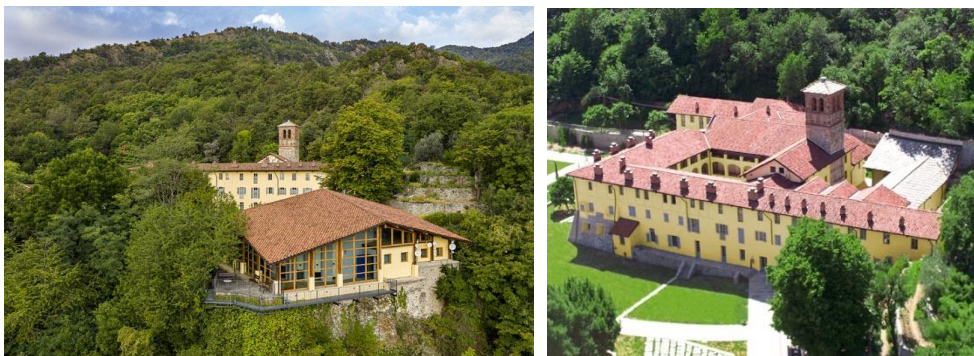
Fig. 20 – Avigliana (TO), certosa dopo l'intervento di restauro

I lavori si sono conclusi nel 2011 (39) con un ingente investimento, in parte sostenuto grazie a fondi europei, regionali e contributi di fondazioni bancarie. Nello stesso anno l'edificio è stato inaugurato al pubblico con il nome di Certosa 1515 (40), configurandosi come luogo di formazione e ospitalità a costi calmierati per pellegrini e turisti in linea con le case religiose (Fig. 20; Fig. 21).