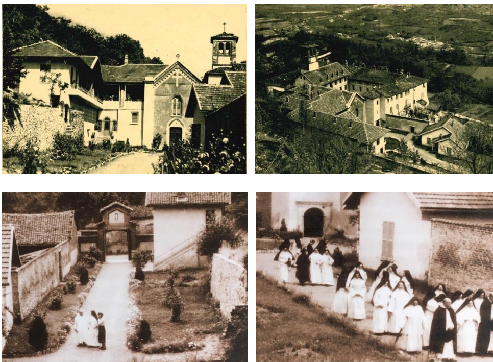
Fig. 18 – Avigliana (TO), certosa durante la presenza delle monache certosine, s.d.

Il 1994 ha segnato uno spartiacque nella storia del complesso, a seguito della decisione delle monache di lasciare Avigliana in vista della costruzione di una nuova comunità a Dego (SV). La dismissione ha posto serie problematiche di riuso del bene (30): al momento dell'abbandono delle monache, il complesso conventuale si presentava come un insieme di volumi eterogenei organizzati intorno al nucleo della chiesa. Al piano terra, sul lato destro dell'edificio, si sviluppava il chiostro porticato a cui corrispondeva, ai due piani superiori, lo spazio distributivo di accesso alle celle delle monache. A nord del campanile, intorno ad una piccola corte rustica, era localizzato il romitorio. Davanti alla certosa, racchiuse entro il muro di recinzione, erano riconoscibili strutture accessorie di supporto alla produzione (fienili, pollai, magazzini, stenditoio e limonaia) (Fig. 18; Fig. 19).