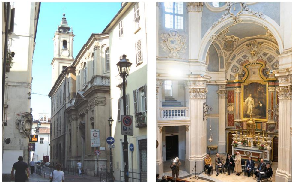
a) Prima degli interventi di restauro