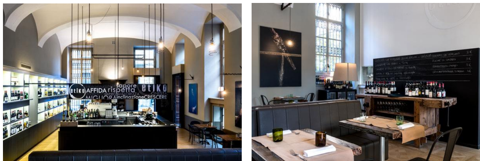
Fig. 16 – EtikØ café bistrot, realizzato nell’Ala Palestro con il progetto A150