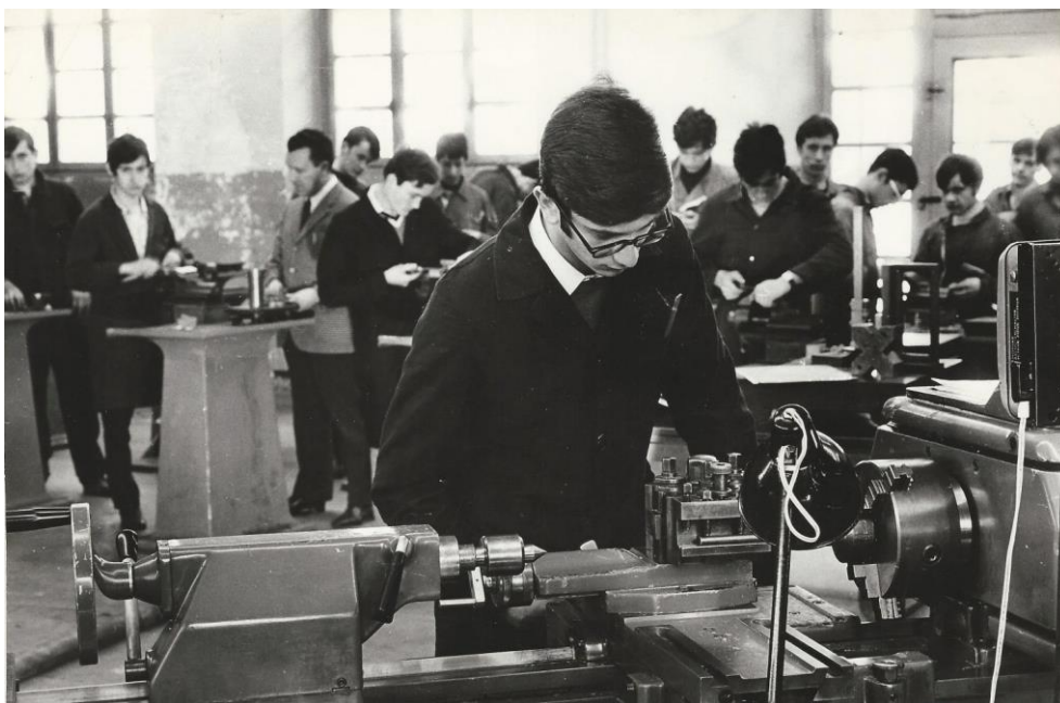
Fig. 10 – Laboratorio dei tornitori, foto storica