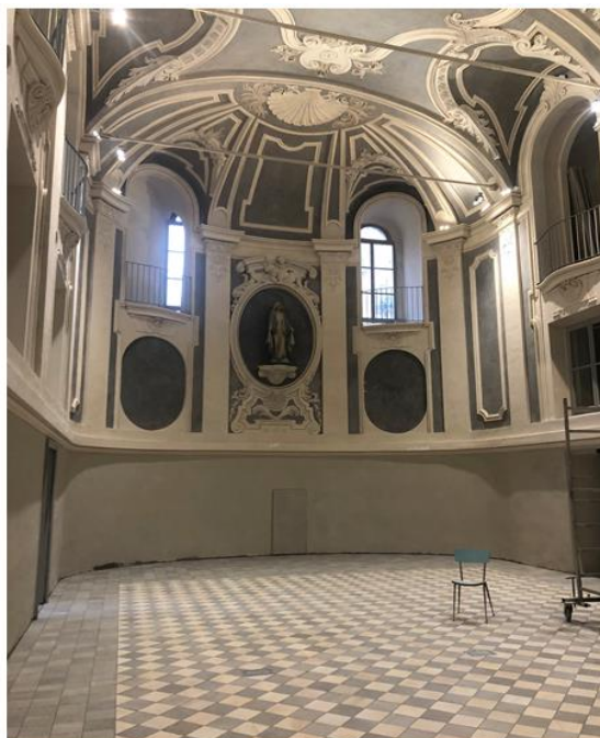
Fig. 6 – Torino, coro della chiesa di Santa Chiara, dopo il restauro

dell'operazione avviata dal Gruppo Abele, il progetto di riuso è in grado di generare risorse volte a sostenere la gestione del bene. I ricavi provengono da progetti di accoglienza, attività di autofinanziamento, contributi degli ospiti. Inoltre, si sottolinea la sostenibilità del processo di cohousing che genera volontari in grado di garantire la gestione e realizzazione delle attività culturali avviate (13). Un modello virtuoso e sinergico nella relazione tra patrimonio culturale rigenerato, risorse umane coinvolte e collettività.