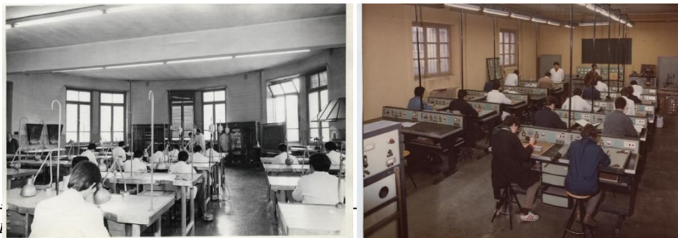
Fig. 9 – Attività di laboratorio in immagini storiche