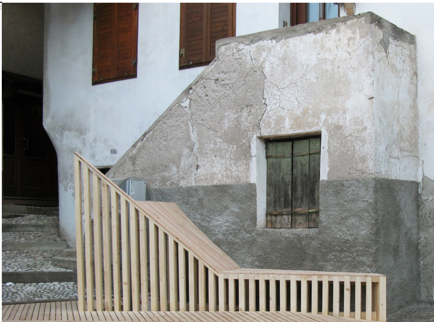
Fig. 2 “1:1 Urban living room”, Tonadico, Valle di Primiero, Trentino. Camposaz, 2013.

7. Tutte queste parole non avrebbero senso se non si esplicitassero due questioni. Con chi , e con cosa . Con chi: oggi è possibile una grande alleanza tra tutte le realtà che da tempo stanno lavorando in termini innovativi sulle aree interne del paese: dai territori della Strategia nazionale per le Aree interne alla rete delle Cooperative di comunità, da “sindacati” a base territoriale come Uncem ai soggetti che hanno firmato piattaforme come il recente Manifesto di Assisi, dalle competenze scientifiche e universitarie che già operano sul terreno alle tante piccole comunità che stanno portando avanti percorsi di rigenerazione. Con cosa – e questo è un tema decisivo, su cui bisogna lavorare in questi immediati prossimi mesi: ossia avere la capacità, a valle degli insegnamenti di questa crisi, di saper riorientare filosofie e obiettivi della prossima programmazione europea, proponendo ad esempio un uso metromontano dei Por e la costruzione di un Pon davvero incentrato sulla metromontanità, che non separi città e aree del margine ma le riconnetta. ■