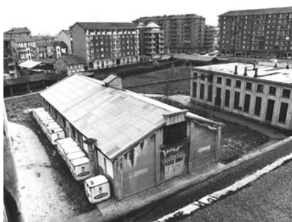
Scheda PS26; ex Venchi Unica – quartiere: Pozzo Strada – indirizzo: via Fenoglio 2 Foto storica; 1975-80 Foto attuale; 2015