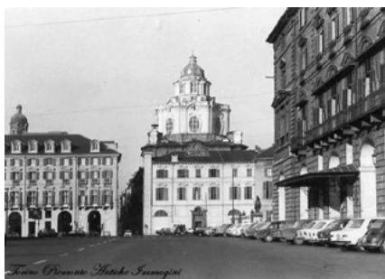
Scheda CE80; piazza Castello – quartiere: Centro – indirizzo: piazza Castello Foto storica; anni 70 – Foto attuale; 2018