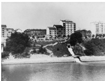
Scheda SS15; corso Galilei 62 – quartiere: San Salvario – indirizzo: corso Galilei 62 Foto storica; 1958 – fonte: Archivio Storico Città Torino (FT 12C02_048) Foto attuale; 2015 – autore: Luca Davico