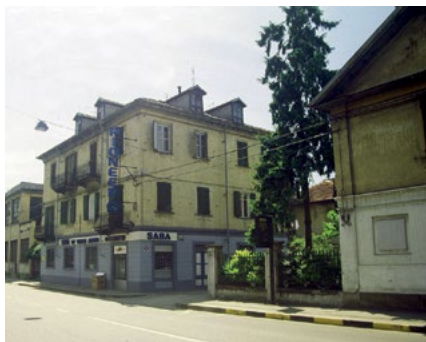
Scheda PD26; ex Paracchi – quartiere: Parco Dora – indirizzo: via Pianezza 41-43 Foto storica; 1994 Foto attuale; 2017