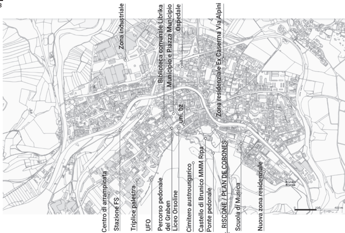
Fig. 3 Brunico città, planimetria di inquadramento.