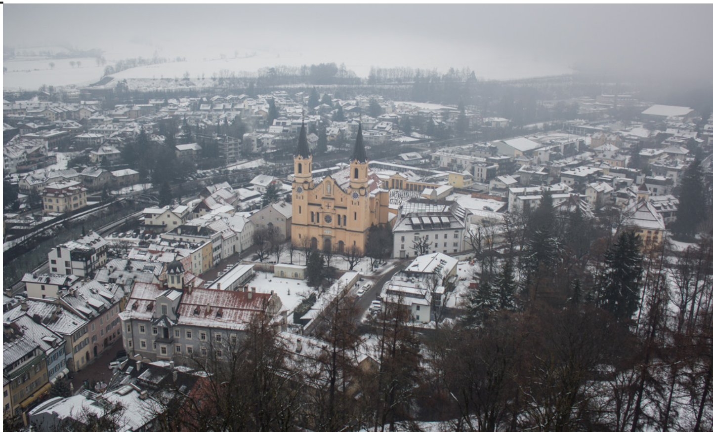
Fig. 1 Vista del centro storico di Brunico dalla torre del Castello.

Questo hub della mobilità, concepito con l'intento di valorizzare il principale punto di interconnessione della Pusteria per il traffico ferroviario e su autobus, non è stato ancora realizzato. Tra le probabili cause di ritardo, i fenomeni di dissesto idrogeologico occorsi in Val Pusteria a fine 2019.