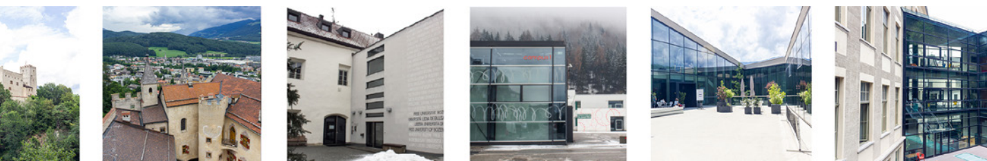
Fig. 4 Architetture del welfare a Brunico.