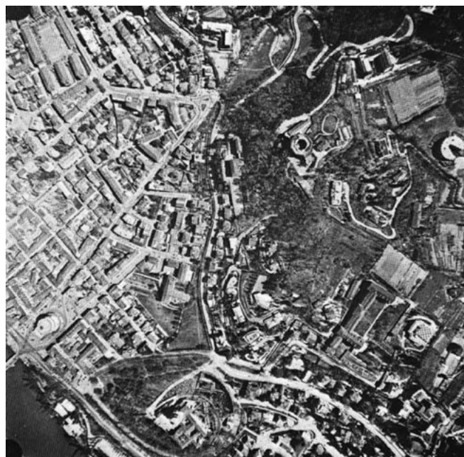
«L'impatto della organizzazione urbana residenziale con la collina in corrispondenza della demarcazione daziaria in destra Po del 1853. (Fotografia aerea zenitale, 1979)» in Torino, p. 215.