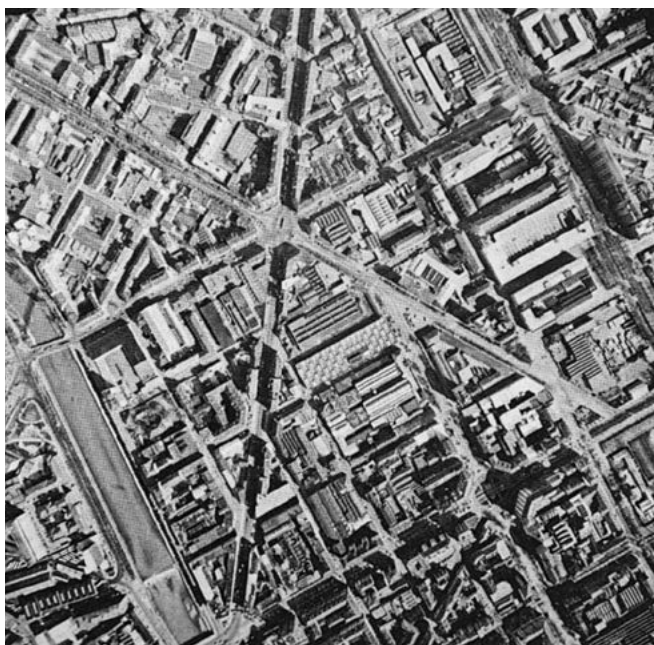
«Schema urbanistico stellare del settore nord della città tra la cinta daziaria del 1853 e la Dora. (Fotografia aerea zenitale, 1979)» in Torino, p. 213.