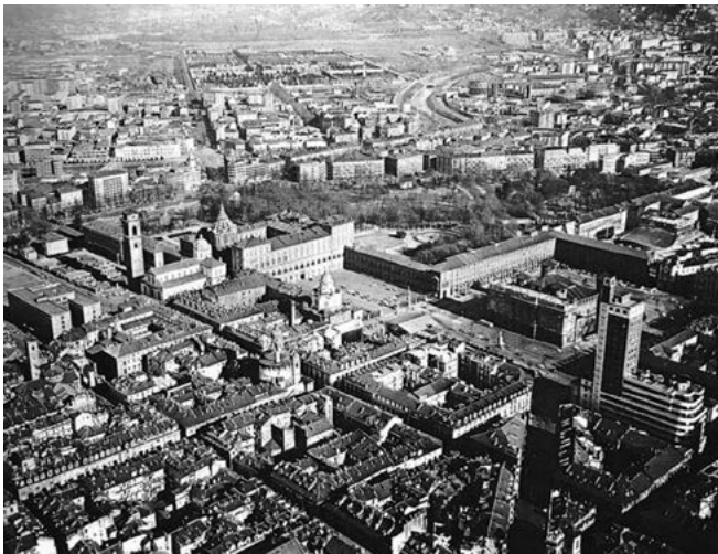
«L'antica "zona di comando" della città con il taglio diagonale di via Pietro Micca e l'inserimento della Torre Littoria nella ricostruzione del primo tratto di via Roma (1931-33). (Fotografia aerea Alifoto, 1970)» in Torino, p. 230.

del nuovo piano regolatore di Torino passava ai milanesi Augusto Cagnardi e Vittorio Gregotti i quali, lungo un decennio, avrebbero elaborato quello che sarà definito il primo "piano di seconda generazione" 27 .