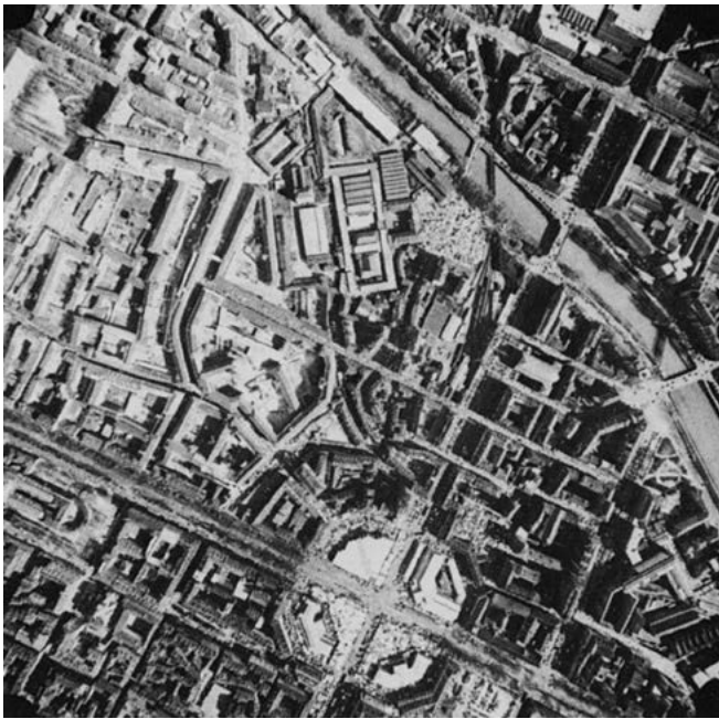
«La foto aerea zenitale della zona nord documenta la persistenza attuale del tessuto antico nel Borgo Dora. Ad esso si è saldata la città del primo Ottocento e sovrapposta la pianificazione successiva senza validi fenomeni di integrazione. (Fotografia aerea zenitale, 1979)» in Torino, p. 186.