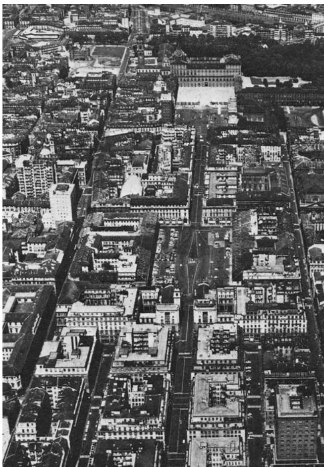
«Piazza S. Carlo e via Roma nuova ricostruita sul sedime dell'antica Contrada Nuova.» in Torino, p. 24.

"direttrici storiche di sviluppo" 7 . In questo quadro, Torino, le sue strade e le sue piazze non appaiono come la scena di fatti politici o economici, né offrono lo sfondo alla vita di corte o alle vicende dell'emergente città borghese dei mestieri, delle corporazioni o della nascente industria meccanica; la città, la sua forma progettata e costruita, nel libro di Comoli è un'entità apparentemente autonoma, risolta in se stessa e dotata di una propria logica interna, così come autonomo è il linguaggio usato per descriverla. Metodologia, fonti e linguaggio definiscono lo specifico disciplinare della Storia dell'urbanistica, distinta dalle altre scienze che studiano la città e praticata da studiosi formati come architetti. Come già è stato scritto, tale tentativo di analisi storica, definizione di categorie di lettura, e formulazione di corrispondenti indirizzi d'intervento troverà concreto riscontro nei due volumi sui beni culturali ambientali della città di Torino 8 , nella monumentale ricerca sui beni paesaggistici per la Regione Piemonte, nelle grandi convenzioni di ricerca e di consulenza per gli enti territoriali, delineando i contorni di un lavoro che, fondandosi sempre su una solida indagine documentaria, non resterà mai relegato all'archivio, ma si farà pienamente storia operativa . Così, una lettura