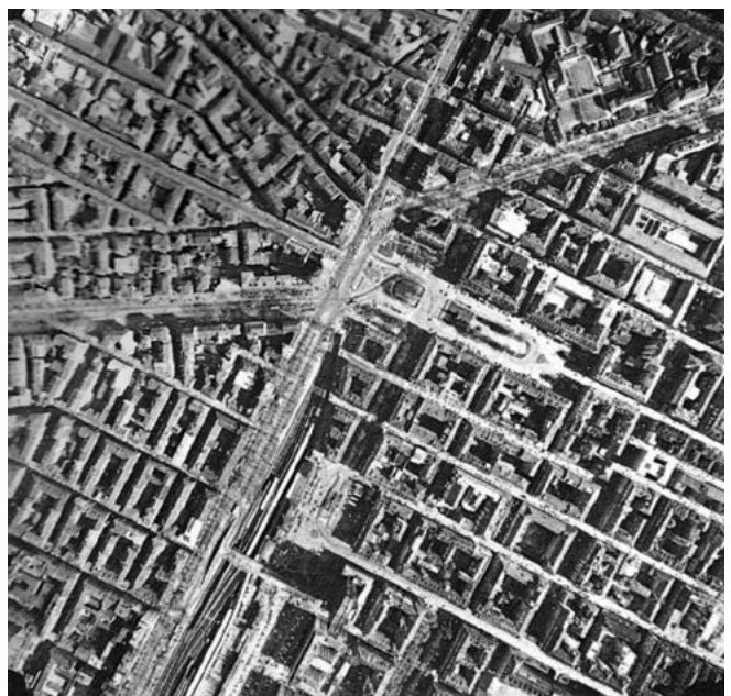
«La zona ovest della città e piazza Statuto. (Fotografia aerea zenitale, 1979)» in Torino, p. 176.

del libro del 1983 disgiunta da questo lavoro che lo precede e ne costituisce in parte la continuazione appare impossibile oltre che parziale.