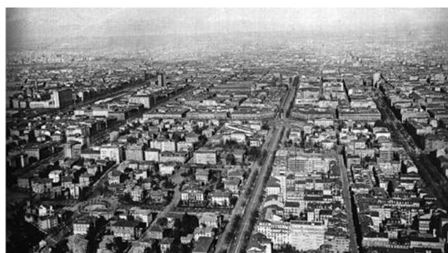
«Veduta aerea del settore meridionale della città. In primo piano la rigida griglia ortogonale dei grandi viali ottocenteschi attestati sul nucleo antico della città.» in Torino, p. 211.