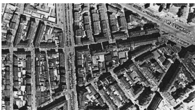
«La configurazione urbanistica separata di Borgo S. Paolo derivata dal Piano regolatore del 1898-1901. (Fotografia aerea zenitale, 1979)» in Torino, p. 213.