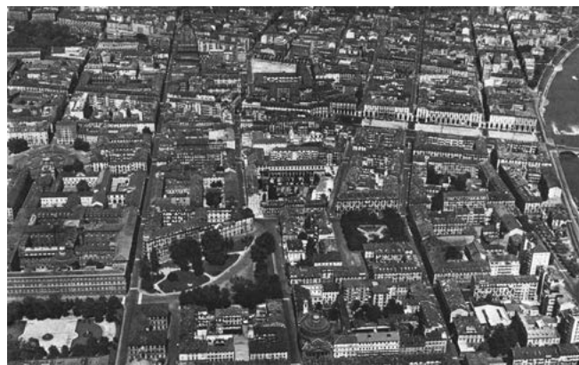
«Il Borgo Nuovo: la saldatura con la città antica è tuttora risolta a zone verdi residuali dell'ottocentesco Giardino dei Ripari.» Torino, p. 140.