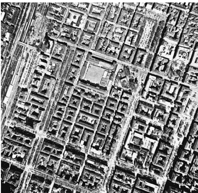
«L'impianto ortogonale dei grandi viali nella zona della ex Cittadella. (Fotografia aerea zenitale, 1979)» in Torino, p. 177.