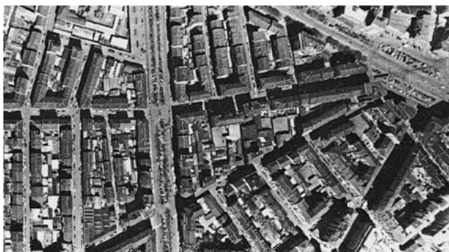
«La configurazione urbanistica separata di Borgo S. Paolo derivata dal Piano regolatore del 1898-1901. (Fotografia aerea zenitale, 1979)» in Torino, p. 213.