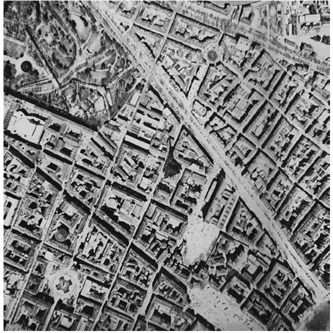
«Il sistema di via Po e piazza Vittorio come momento urbanistico di forte coesione strutturale. La griglia stradale delle espansioni ottocentesche è retta dalla ortogonalità con l'asse longitudinale della piazza. (Fotografia aerea zenitale, 1979)» in Torino, p. 134.

la discussione sulle risorse culturali quali elementi chiave del rilancio della città appare centrale, nell'amministrazione come fra le élite professionali locali.