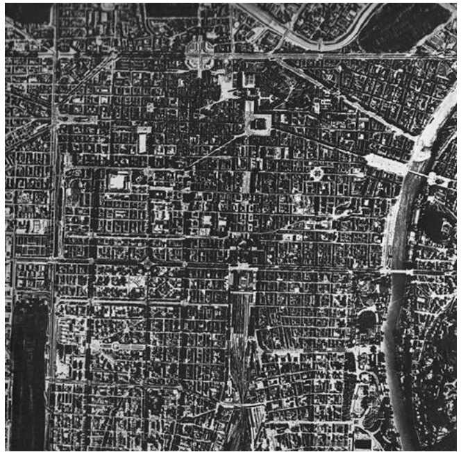
«Fotografia aerea zenitale della zona centrale della città nell'area corrispondente al Piano di ingrandimento della Capitale del 1850-1851. (Firenze, Istituto Geografico Militare, 1971)» in Torino, p. 189.