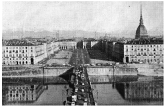
«Piazza Vittorio e il ponte napoleonico in pietra. La fotografia documenta il rigido skyline, apparentemente orizzontale, della piazza.» in Torino, p. 131.