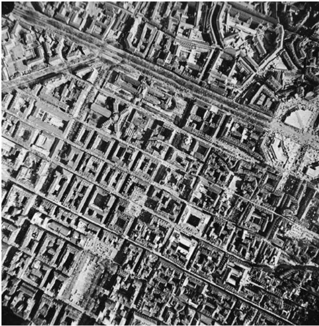
«La struttura urbanistica di originario impianto romano in corrispondenza del castrum. (Fotografia aerea zenitale, 1979)» in Vera Comoli Mandracci, Torino, Laterza, Roma-Bari, 1983, p. 6.