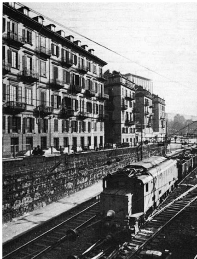
«Tipi edilizi di palazzi “da reddito” in corso S. Martino: il fronte posteriore prospettante la “ferrovia di Novara”» in Torino, p. 178.