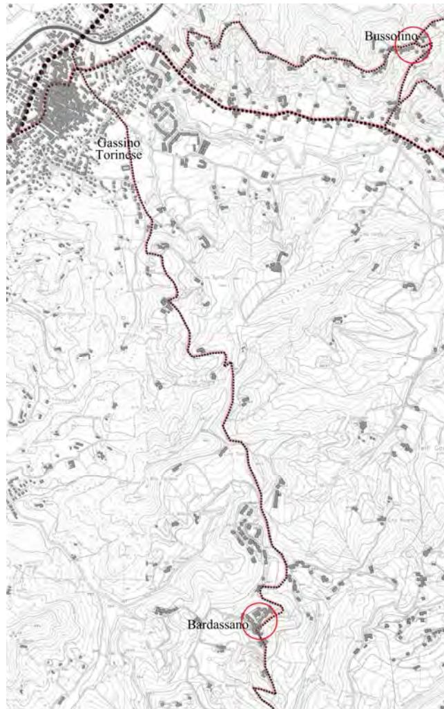
Fig. 5 – Mappa del territorio compreso tra Gassino Torinese, Bussolino e Bardassano con indicati i siti di progetto – Fonte: rielaborazione dell'autore

Gassino Torinese, l'Archivio di Stato di Torino e l'Istituto Geografico Militare, è stato possibile rintracciare tanto le valenze territoriali quanto i diversi caratteri tipologici ricorrenti relativi alle singole costruzioni. Lo sviluppo di un'analisi storica condotta su differenti ambiti disciplinari ha permesso quindi l'articolazione di innovative strategie di intervento per far fronte allo spopolamento di ciascuna area oggetto di studio.