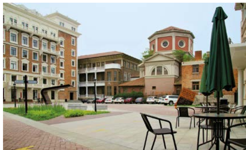
La Concessione italiana di Tianjin, l'unica delle otto realizzate all'inizio del XX secolo a essere rimasta in piedi, insieme a parti di quella inglese