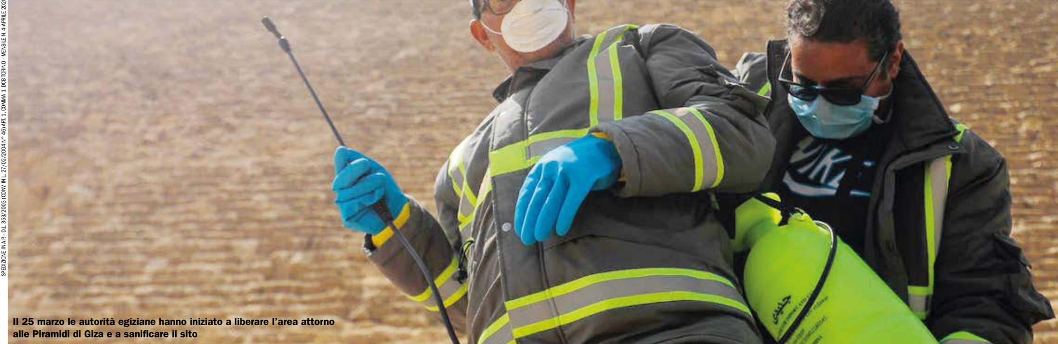
Il 25 marzo le autorità egiziane hanno iniziato a liberare l'area attorno alle Piramidi di Giza e a sanificare il sito

Nei giorni dell'emergenza il web è pieno di arte. Musei, gallerie, aste e artisti si rivolgono al digitale e al virtuale per dimostrare di esistere ancora, inventandosi progetti e proposte. Nessuno sa che cosa succederà: chi sopravviverà e come? Ma l'arte resterà (e non solo in rete)