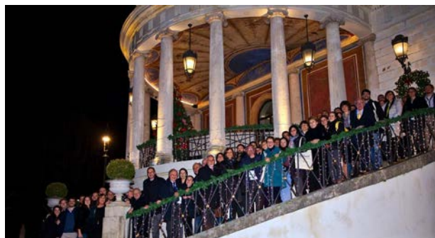
Foto di gruppo alla cena di gala tenutasi alla Casina Valadier

In un'atmosfera pienamente prenatalizia, i partecipanti all'evento si sono infine ritrovati alla cena sociale, un evento di marcata eleganza presso la Casina Valadier, incantevole villa realizzata dal noto architetto Valadier immersa nei giardini del Pincio. La cena con vista su una