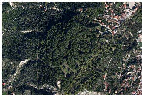
Fig. 6. Forte di Zante. Vista aerea attuale.

Città priva d'ogni altra Fortezza" (Coronelli, 1696, p. 180). Nel Forte risiedono principalmente gli Stati Maggiori del Governo e col tempo, con l'affermarsi del porto di Zante e della sua città, risulterà sola residenza dei diversi corpi di armata che si susseguiranno ai Veneziani anche inserendo nuove attività e rifunzionalizzando quanto già di abbandonato (infermeria, ospedale, scuola, biblioteca).