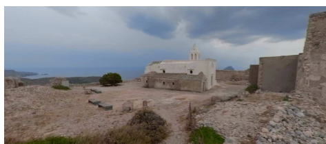
Fig. 12. Forte di Cerigo. La chiesa ortodossa Sta. Myrtiliotissa nella parte del Castello. Stato attuale.

A differenza degli altri siti analizzati in questo caso permangono alcuni edifici isolati (le due chiese, le cisterne, parte del quartiere delle milizie) che permettono ancora di far emergere l'organizzazione distributiva delle antiche strade e la localizzazione dei servizi (Fig. 12).