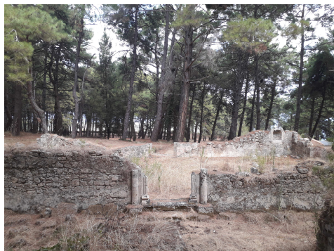
Fig. 7. Il Forte di Zante, resti della chiesa di S. Francesco, stato attuale (Gkrimpa, 2019).

Alle modifiche funzionali e alla dismissione, per Zante, subentrano i grandi terremoti quello del 1893, del 1953 e quello del 1971 che demoliscono l'intero abitato. Attualmente (Figg. 6-8) è possibile riconoscere i sedimi di alcune chiese dal loro tracciato di fondazione: S. Francesco, S. Giovanni Battista, S. Salvatore, B.V. Laurentiana, S. Venerando, S. Giovanni Teologo e alcuni degli edifici militari in elevato: le prigioni e la polveriera, per il resto una folta pineta ha trasformato integralmente il paesaggio, cancellando le antiche strade e i ruderi sono avvolti dalla ve-