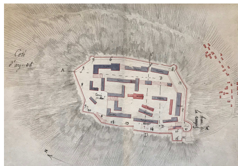
Fig. 3. Martin, Gouvernement des Isles Ionienne / Direction de Corfou / Plan du Fort St. Georges à Cephalonie , Corfou 1808 (AMDF, 1 VM 68, stralcio).

niale si racconta e si raffigura il Forte come ancora abitato, con l'ingresso nello spigolo sud-ovest dove si susseguono in salita una serie di piccole corti passanti che immettono sui camminamenti lungo muro sino a salire, sul lato a nord, nella parte più elevata (AGATP, 1808). Lo spazio centrale è suddiviso in diverse corti delimitate da una ventina di fabbricati che in parte si elevano a tutta altezza e in parte sfruttano le diverse quote per utilizzare spazi interrati, disposti per lo più in linea assecondando i diversi dislivelli, il costruito accoglie "le residenze del comandante, dei suoi ufficiali, i templi, le case nobili, i magazzini, le cisterne" (Τεχνικόν, 1973, p. 111).