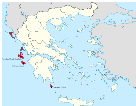
Fig. 1. Le isole ioniche e le fortezze analizzate.

Il patrimonio che si può iscrivere come Fortezze delle Isole Ioniche è molto vario e riguarda da piccoli castelli a vere e proprie città, questo coinvolge non solo le grandi isole ma anche le piccole e gli scogli, sono strutture o totalmente rifunzionalizzate come quella di Corfù, o ridotte a pochi ruderi oggi difficilmente individuabili. Un patrimonio oggetto di tutela da parte dell'Eforato –Ministero della Cultura e dello Sport– responsabile dello svolgimento delle indagini preliminari, della conservazione, restauro e valorizzazione del bene, garantendone anche la visita.