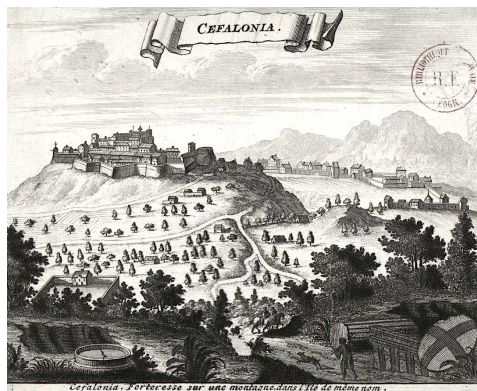
Fig. 2. Cefalonia, incisione [XVIII secolo], BNF Paris.

Posto a sud-ovest dell'isola, nell'entroterra, a circa 5 Km dal mare, in cima a una collina ripartita dal Monte Nero, il Forte di S. Giorgio domina la piana di Argostoli (Fig. 2). Le sue origini sono antiche e lo mostra la sua conformazione che sfrutta l'andamento del terreno, recinto da un muro continuo spezzato nel suo sviluppo tanto da disegnare in modo irregolare una forma quasi ovale, questa risulta interrotta sui punti cardinali da quattro spazi o torri di avvistamento. Il Castello già in epoca medievale era considerato la città capitale dell'isola, trasferita poi nel 1754 ad Argostoli.