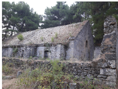
Fig. 8. Il Forte di Zante, resti della Polveriera, stato attuale (Gkrimpa, 2019).

getazione. La sola permanenza effettiva che disegna la sommità della collina, perché integre, sono le mura e i bastioni che oggi delimitano un grande parco.