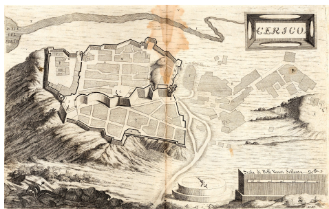
Fig. 9. Cerigo, incisione (Coronelli, 1696).

toKratör. Il terzo settore è quello posto a valle che avvolge e protegge il Forte lungo il lato est dalla Porta Maggiore al Bastione del castello e l'iconografia (Fig. 9) mostra un quartiere abitato con propria chiesa (Coronelli, 1696).