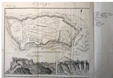
Fig. 10. Plan de la ville de Cerigo avec 2 vues, 1799 (AMDF, 1 VM 68)

La relazione redatta dal Comandante francese delle Isole di Levante Wallonque nel 28 maggio 1798, che analizza nel dettaglio lo stato dei luoghi, mostra una situazione all'epoca alquanto degradata. (Fig. 10) “Non si può guardare questa fortificazione come a una vera Fortezza poiché manca delle abitazioni solide per la Guarnigione e per i magazzini delle vivande e dell'artiglieria [...] il Fronte dove si trova l'Entrata a contatto con il Borgo dove all'interno è formata da una Facciata frantumata con due semi Bastioni [dove] manca il parapetto e la piattaforma per mettere una batteria [...]. Le abitazioni non sono in buono Stato, una Guarnigione di 80 uomini avrebbe difficoltà a mettersi al riparo. Il Corpo di Guardia del quartiere e del Comandante, detto Palazzo Pubblico, manca del cosiddetto Campo;