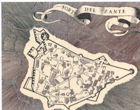
Fig. 5. Fortezza del Zante, incisione (Coronelli, 1687).

Per l'ampiezza della superficie circoscritta, il Forte accoglie al proprio interno una piccola città con caserme, polverieri e prigioni ma anche chiese, conventi, case, mulino, spazi per la coltivazione, il mercato e approvvigionamento dell'acqua (18 fontane e 4 pozzi), un vero e proprio borgo composto alla metà del XVI secolo da ben 256 case (Μυλωνά, 2003, p. 31).