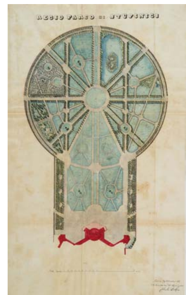
Fig. 5. DELFINO COLOMBO, Regio Parco di Stupinigi (31 dicembre 1876), Archivio di Stato di Torino, Casa di Sua Maestà , m. 2116.

l'incontrollata diffusione e accrescimento di vegetazione spontanea – permance reiterata da quasi tre secoli, rafforzando la straordinaria continuità compositiva tra palazzo, giardino cintato, boschi di caccia e territorio propria del progetto juvarriano.