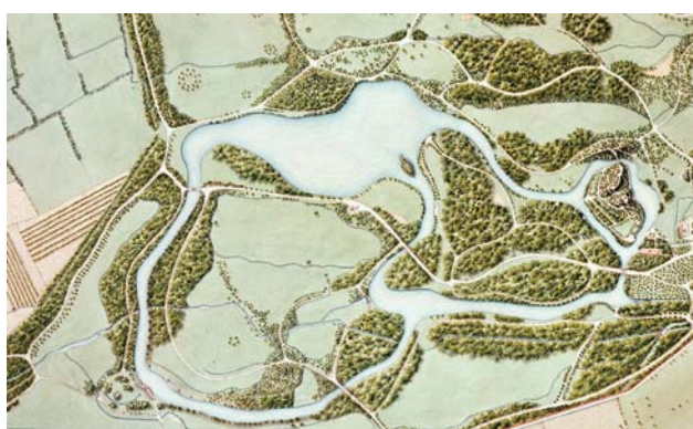
Figg. 2-3. Confronto tra un dettaglio del Piano geometrico del 1839 e un'immagine satellitare odierna: l'area centrale del parco, costituita dalle tre isole, è habitat ideale per avifauna e altre numerose specie di animali. Le profonde differenze nella consistenza della vegetazione potranno essere appianate soltanto gradualmente, grazie a interventi puntuali, programmati nel tempo e non invasivi per l'ecosistema e le specie che vi vivono.