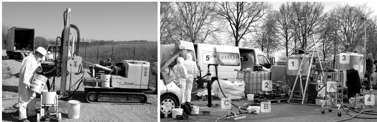
Fig. 4. A sinistra: iniezione di nZVI tramite direct push; a destra: iniezione di nZVI tramite permeazione, (1) contenitore per la preparazione delle sospensioni, (2) unità di dispersione e ricircolo, (3) contenitore per lo stoccaggio delle sospensioni, (4) pompa d'iniezione, (5) pozzo d'iniezione, (A) misuratore di portata, (B) misuratore di suscettività magnetica, (C) misuratore di pressione.

Left: direct push injection of nZVI with a geoprobe; right: permeation injection of nZVI, (1) suspension preparation, (2) dosage unit, (3) storage tank, (4) injection pump, (5) injection well, (A) flow-meter, (B) magnetic susceptivimeter, (C) pressure gauge.