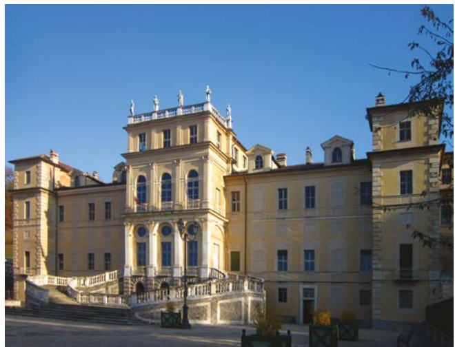
Figura 6. Torino, Villa della Regina.