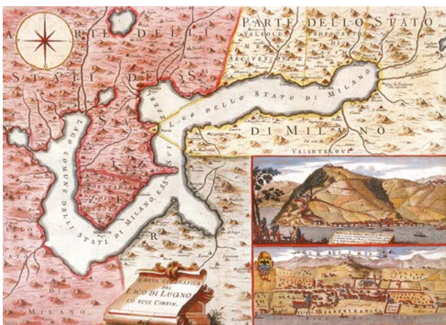
Figura 1. Giorgio Domenico Fossati, Carta corografica del Lago di Lugano co' suoi confini, 1740, Bellinzona, Archivio di Stato del Canton Ticino, Fondo Stampe.

Dalle sollecitazioni derivate dai primi studi di Vera su questi temi, sono stata coinvolta in un articolato progetto di ricerca concernente l'attività svolta dalle maestranze lombardo-ticinesi nei cantieri del Barocco nel Piemonte sabauda 2 ; tale progetto, costantemente condotto sotto la sua direzione scientifica, è stato avviato nel 2003 con l'esame sistematico del materiale documentario conservato all'interno dell'Archivio della Compagnia di Sant'Anna dei Luganesi in Torino 3 , associazione che venne istituita a Torino all'inizio degli anni venti del Seicento, con funzione di identificazione culturale e sociale, assistenziale e di rappresentanza, e che riuniva al suo interno figure professionali attive nel campo dell'edilizia e della decorazione (quali capomastri da muro, stuccatori, scarpellini, marmorari, fornaciai, pittori, ma anche architetti e ingegneri), accomunate dalla medesima origine geografica, la regione dei laghi lombardi (cioè la Valsolda e la Val d'Intelvi per lo Stato di Milano e l'attuale Canton Ticino) 4 (Figura 1). L'Archivio raccoglie la documentazione prodotta in maniera continuativa dalla Compagnia a partire dal 1636 5 , anno della sua fondazione ufficiale, per giungere sino alla seconda metà del XX secolo; benché le carte specificino soltanto in modo sporadico la professione dei membri della Compagnia, senza testimoniare la loro attività nei