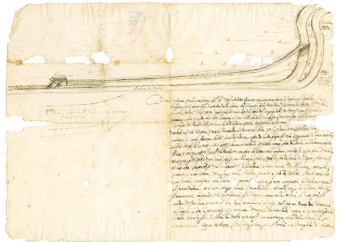
Figura 3. Antonio Bettino, progetto per la modifica del corso della bealera della Polveriera, 11 gennaio 1674. Archivio Storico della Città di Torino, Carte Sciolte, n. 1989 recto.

La documentazione prodotta dagli organi istituzionali dello Stato sabauda costituisce pertanto un vero e proprio compendio di tecniche materiali; il suo studio ha permesso un approfondimento su sistemi di approvvigionamento, metodi di produzione e qualità dei materiali da costruzione, ambito nel quale alcuni impresari, quasi sempre di origine ticinese, partecipavano anche ai processi produttivi (in quanto proprietari di fornaci da calce o di laterizi) oppure erano protagonisti, grazie alle competenze acquisite nella lavorazione di pietre e marmi, nella ricerca di nuovi idonei siti di estrazione. Questo materiale documentario è inoltre fondamentale per comprendere i rapporti fra committenza, progettisti, maestranze e figure preposte al controllo della realizzazione delle opere, i relativi ruoli, competenze e responsabilità e le gerarchie all'interno del cantiere. È attraverso lo studio di documenti di questo tipo che è stato possibile individuare il percorso di 'crescita professionale' seguito da alcune figure provenienti dalla regione dei laghi lombardi.