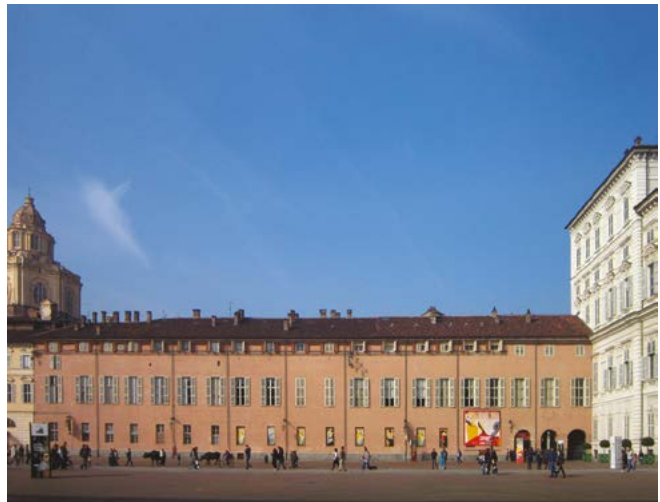
Figura 5. Torino, palazzo Chiabrese, manica prospiciente piazzetta Reale.

Gli incarichi presso i Savoia furono all'origine, per i Tosetti, di una significativa ascesa sociale, che si concretizzò in un'intensa pratica creditizia e nell'acquisizione di un ingente patrimonio fondiario e di un notevole prestigio in patria, con cui erano sempre stati tenuti vivi i rapporti. A Castagnola il rilievo sociale raggiunto nell'ambito della comunità locale si manifesta con la costruzione di un palazzo e con la committenza per la parrocchiale di San Giorgio, che nella seconda metà del Seicento viene riplasmata nelle forme barocche che ancora oggi la connotano, e al cui interno i Tosetti fanno edificare la cappella patronale di famiglia (Figura 8). Lo studio dei documenti conservati all'Archivio di Stato di Torino ha permesso di ricondurre i nodi sabaudi in stucco che ornano la sommità delle lesene