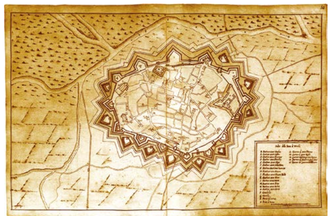
Figura 4. Michel Angelo Morello, Indice della Pianta di Vercelli, s.d., pianta delle fortificazioni di Vercelli nella seconda metà del XVII secolo. Istituto Storico e di Cultura dell'Arma del Genio, BB.ICO. 951/ID. 8858, tav. 10.