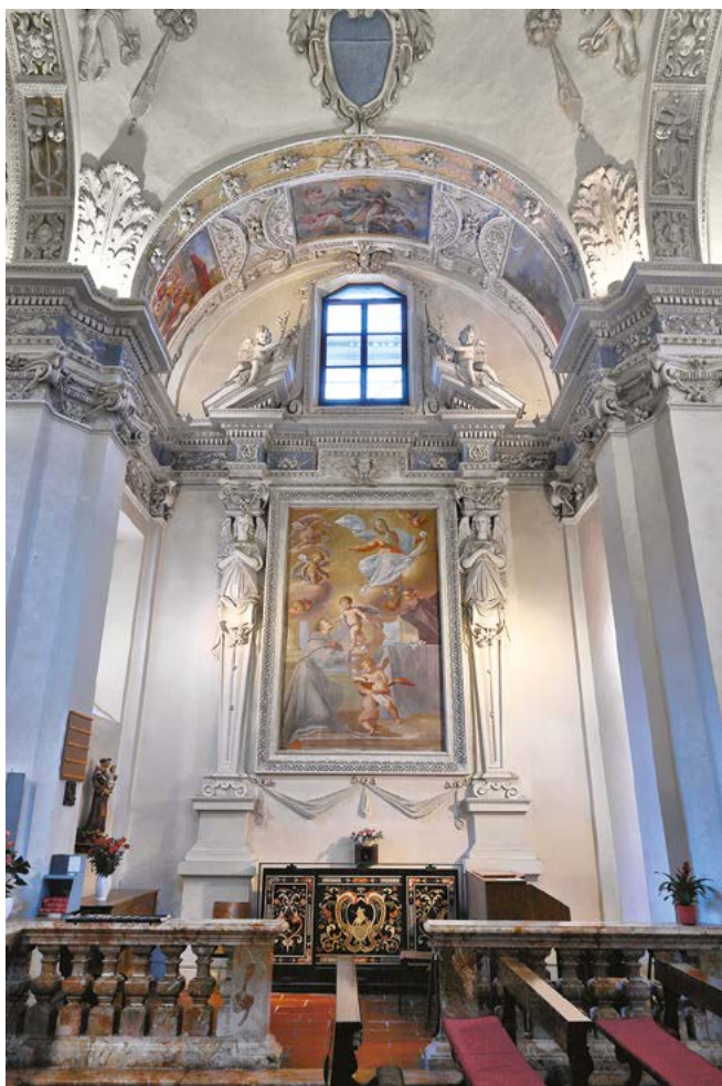
Figura 8. Castagnola (Lugano), chiesa parrocchiale di San Giorgio, cappella di Sant'Antonio da Padova, di patronato della famiglia Tosetti.

poste ai lati della cappella a una forma di omaggio ai Savoia, committenti che resero possibile la carriera e l'ascesa sociale dei principali membri della famiglia.