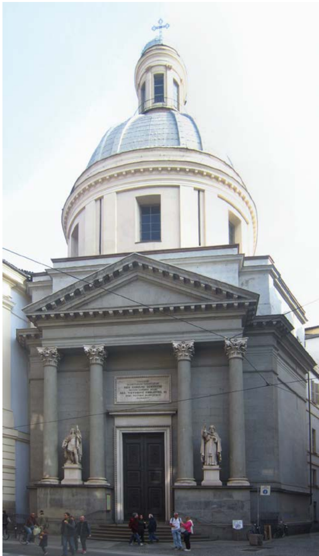
Figura 2. Torino, Basilica Mauriziana, facciata.

Il lavoro nel cantiere era quindi un momento essenziale per costituire una base formativa per la buona pratica edilizia. Qui le figure professionali, in gran parte di origine lombardo-ticinese (più frequentemente capomastri da muro, pittori, scultori e stuccatori, ma anche architetti o ingegneri), venivano a contatto e si confrontavano con competenze diverse, con figure istituzionali che dirigevano e controllavano il loro operato, e dovevano seguire strumenti di comunicazione del progetto e delle modalità costruttive quali disegni e istruzioni: un'esperienza che concorrevano a formare un vasto patrimonio di conoscenze, teoriche e pratiche.