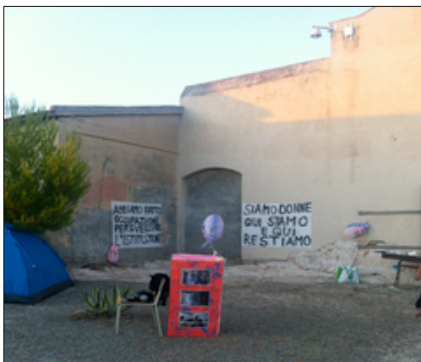
Figura 3. L’esterno del presidio

o meno stabile lungo l’arco dei cinque mesi. Pranzi, cene e feste hanno accompagnato questa esperienza di occupazione, insieme alla raccolta di abiti per bambini e adulti. Inoltre, a partire da agosto, lo spazio occupato ha ospitato quotidianamente, nel periodo pomeridiano, attività rivolte ai bambini del quartiere dai 5 ai 13 anni, con attività ludiche e di supporto scolastico. Queste attività ricreative sono state agevolate anche dal materiale già presente – anche se in abbandono, spesso in buono stato - nell’ex scuola dell’infanzia: sedie piccole, banchi e banchetti; giochi, tricicli, colori, etc.. Questa azione si poneva l’obiettivo di dare spazi di socialità sicuri ai bambini del quartiere e di fornire un servizio gratuito alle famiglie, fortemente provate, qui più che altrove, dalla crisi socio-economica dilagante.