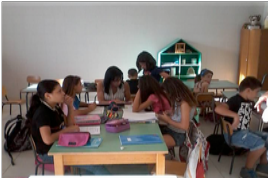
Figura 4. L'interno della struttura durante un pomeriggio dedicato alle attività didattiche.

Nonostante l'accordo finale e i forti contatti tra associazione e alcuni consiglieri comunali della precedente giunta, anche a Sant'Elia rimane forte l'opposizione (almeno manifesta) contro l'amministrazione cittadina accusata di aver abbandonato il quartiere e, soprattutto, di non supportare l'azione di rinnovamento sociale avviato dall'associazione: