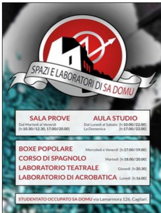
Figura 1: Manifesto che indica gli spazi e le attività di Sa Domu .

Sa Domu è uno dei pochissimi edifici occupati totalmente autogestiti e autofinanziati a Cagliari. Il 12 dicembre 2014 un gruppo di 350 studenti delle scuole medie e superiori ha deciso di occupare la sede staccata di una scuola media abbandonata da anni nel quartiere storico di Castello. L'intento era quello di creare un centro culturale autogestito e gratuito rivolto a tutta la cittadinanza, in aperto contrasto con i tagli all'istruzione, al diritto allo studio e al numero degli alloggi per